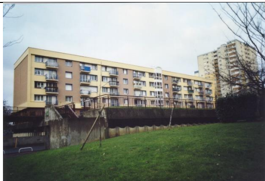
Immeuble HLM à Montreuil (93) rénové en 2002

Les résultats de simulation ont été confirmés par le retour d'expérience concernant un immeuble HLM construit en 1969 à Montreuil (93) et rénové en 2002 (Peuportier, 2004). Les mesures effectuées l'année suivant les travaux, en particulier lors de la canicule d'août 2003, ont montré que l'isolation par l'extérieur et le remplacement des fenêtres à simple vitrage par des double-vitrages à basse émissivité ont permis de maintenir la température intérieure maximale à 10 degrés de moins que la température extérieure (cf. Figure ci-dessous).