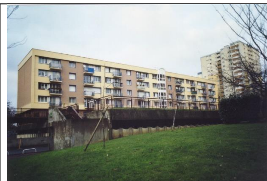
Immeuble HLM à Montreuil (93) rénové en 2002

Les résultats de simulation ont été confirmés par le retour d'expérience concernant un immeuble HLM construit en 1969 à Montreuil (93) et rénové en 2002 (Peuportier, 2004). Les mesures effectuées l'année suivant les travaux, en particulier lors de la canicule d'août 2003, ont montré que l'isolation par l'extérieur et le remplacement des fenêtres à simple vitrage par des double-vitrages à basse émissivité ont permis de maintenir la température intérieure maximale à 10 degrés de moins que la température extérieure (cf. Figure ci-dessous).