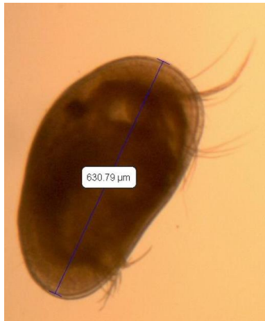
Figure 3 : Illustration de l'ostracode Heterocypris incongruens

Les ostracodes font partie des organismes épibenthiques de la méiofaune. Ils appartiennent à l'embranchement des Arthropodes et au phylum des Crustacés. On les retrouve dans une grande variété de substrats et de milieux aquatiques. Ils présentent une carapace bivalve et possèdent un appendice leur permettant de générer un courant d'eau favorisant les échanges gazeux. Parmi les ostracodes, Heterocypris incongruens (figure 3) est une espèce omnivore d'eau douce appartenant à la famille des Cyprididae. Commune en Europe et en Amérique, sa reproduction est parthénogénétique et conduit à la production d'œufs de résistance (kystes). La taille de la larve (nauplius), varie entre 150 et 250 µm. La croissance des nauplii s'effectue par mues jusqu'à l'âge adulte où leur taille peut atteindre 1500 µm.