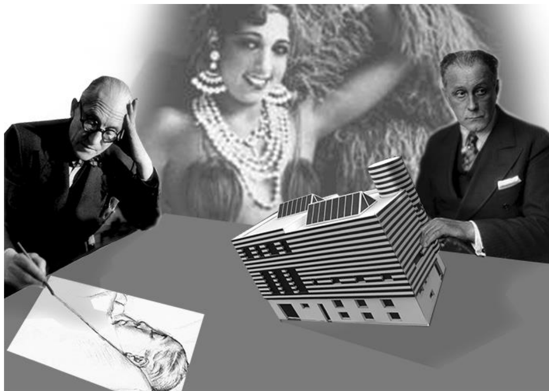
Adolf Loos, Joséphine Baker et Le Corbusier - montage photographique

Joséphine Baker était comme une petite enfant simple et limpide. (...) Joséphine, merveilleuse artiste. Comme ses chants nègres d'alors étaient beaux... Quelle dramatique sensibilité dans sa manière de chanter, dans sa façon de danser. Jamais elle n'a été utilisée comme elle le méritait. 27