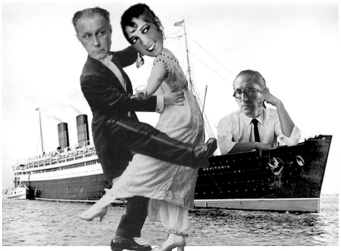
Adolf Loos, Joséphine Baker et Le Corbusier - montage photographique