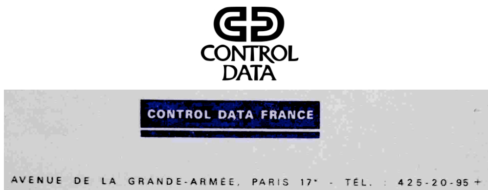
Figure 1. Logos Control Data.

En 1961, Control Data envisage d'abord de confier à Philips la vente de ses ordinateurs en Europe. Les négociations achoppent sur l'exigence de Philips d'étendre l'accord aux États-Unis : CDC craint d'y être phagocytée par le géant européen. Bill Norris se résout donc à créer des bureaux de vente : le premier à Lucerne (Suisse), le deuxième à Francfort (République fédérale allemande), couvrant l'Europe centrale et plus tard les pays de l'Est. Un troisième s'ouvre à Paris en mars 1963, couvrant la France et les pays méditerranéens.