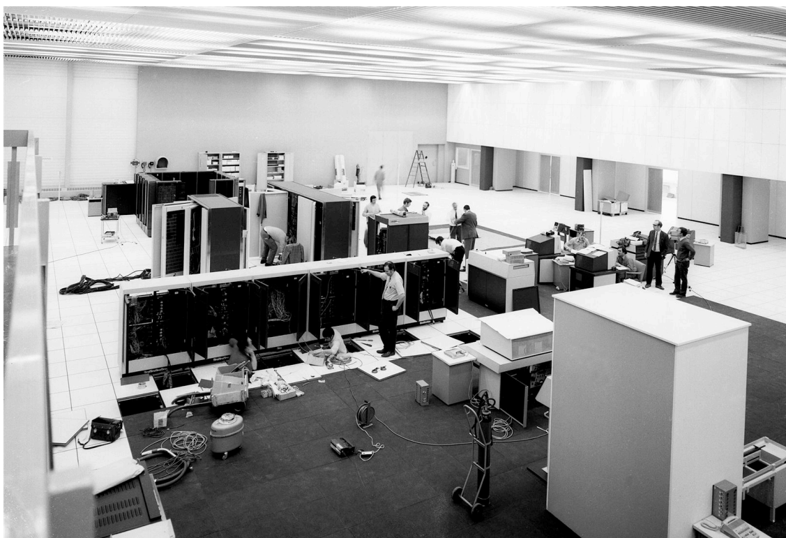
Figure 12. Montage final du CDC 7600 au CERN (février 1972, © CERN).

L'un des principaux clients est le Centre européen de recherche nucléaire (CERN) qui s'est doté fin 1964 d'un gros CDC 6600, régulièrement augmenté en puissance et en mémoires. Aux frontières à la fois de la Suisse, de la science et des capacités budgétaires, ce pôle mondial de la physique des hautes énergies semble avoir des besoins illimités de traitement de données. En avril 1968, un Computer study group du CERN passe en revue les projets de gros ordinateurs annoncés par les constructeurs mondiaux, du CDC 7600 (prototype) au Telefunken TR 440 ; puis lance un appel d'offres for expanding the capacity of the central computing facility , auquel répond l'agence CDC de Zurich. Le choix se porte finalement sur un CDC 7600, qui restera en service pendant plus de 12 ans 47 .