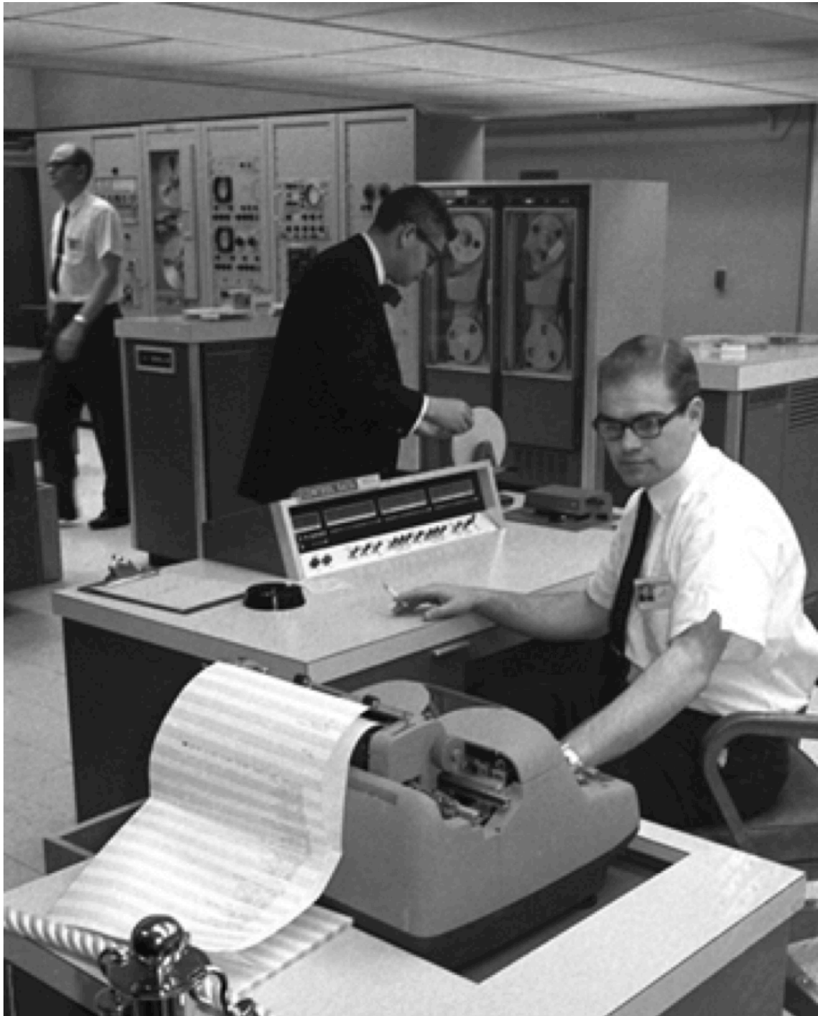
Figure 2. Ordinateur CDC 160A, premier produit de Control Data. Un exemplaire sera installé au Collège de France.

Control Data est une jeune compagnie peuplée d'ingénieurs qui ont peu de savoir-faire managérial et aucune expérience internationale. La plupart ne sont guère sortis de leur Mid-West et ne parlent aucune autre langue que l'Américain. L'adaptation à l'Europe de 1962 est donc d'abord assez difficile. D'autant qu'ils entrent souvent en conflit avec le siège américain qui ne veut pas comprendre les spécificités des pays européens : « The world does not operate the way Minneapolis operates, and policies and procedures that work at home often prove unworkable elsewhere. » constate l'un d'eux. Ils commencent par découvrir des problèmes