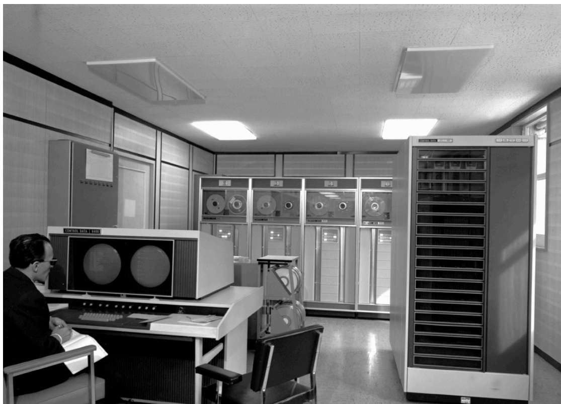
Figure 10. CDC 6400 de la Météorologie nationale, à Paris fin 1967. Les gros ordinateurs Control Data sont parmi les premiers dotés d'un terminal-écran, dès le milieu des années 1960. Cette interface ne se répandra qu'une décennie plus tard sur les systèmes informatiques courants.

En octobre 1967 la Météorologie nationale commande un CDC 6400, livré un mois plus tard – le sixième ordinateur de cette classe installé en France. La SEMA, consultée comme experte par la Météorologie nationale, semble avoir été tiraillée entre deux intérêts : liée à Control Data, elle tend à conseiller l'acquisition d'une machine CDC seule capable des performances nécessaires ; aspirant à devenir un acteur important du Plan Calcul, elle devrait recommander les machines du champion national CII. Finalement on aboutit à un compromis satisfaisant tout le monde : le Control Data 6400 sera complété trois ans plus tard par deux CII 10.070 servant d'interface pour la commutation de messages du réseau météo mondial. D'ailleurs toutes ces machines sont d'origine américaine.