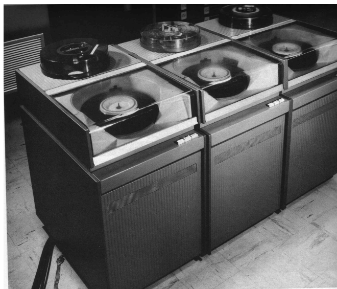
Figure 11. Disques CDC (début des années 1970) (photo CII)

Ses principales spécialités, les disques magnétiques et les gros ordinateurs scientifiques, sont complémentaires de celles des deux constructeurs européens (contrairement à la légende, le Plan Calcul ne vise pas à répondre aux besoins du nucléaire en super-calculateurs). Control Data est à la fois une firme prestigieuse par ses capacités d'innovation et un modèle de réussite face à IBM, à qui l'oppose d'ailleurs un procès retentissant. Devenue le principal producteur mondial de périphériques OEM, elle se lance en 1970 dans les périphériques plug-compatible , attaquant directement l'un des marchés les plus profitables d'IBM. Pour CDC, particulièrement bien implantée en France, il est intéressant de s'associer avec le Plan Calcul pour éviter d'en souffrir localement et pour mieux établir sa percée sur le marché européen. Et la petite CII, qui semble guérie de ses maladies infantiles et grandit de 28 % par an, n'est pas à négliger. Les responsables du Plan Calcul, qui vont régulièrement aux États-Unis visiter Control Data et d'autres constructeurs informatiques, sont favorables à ce rapprochement à condition qu'il soit équilibré par d'autres accords avec des firmes européennes.