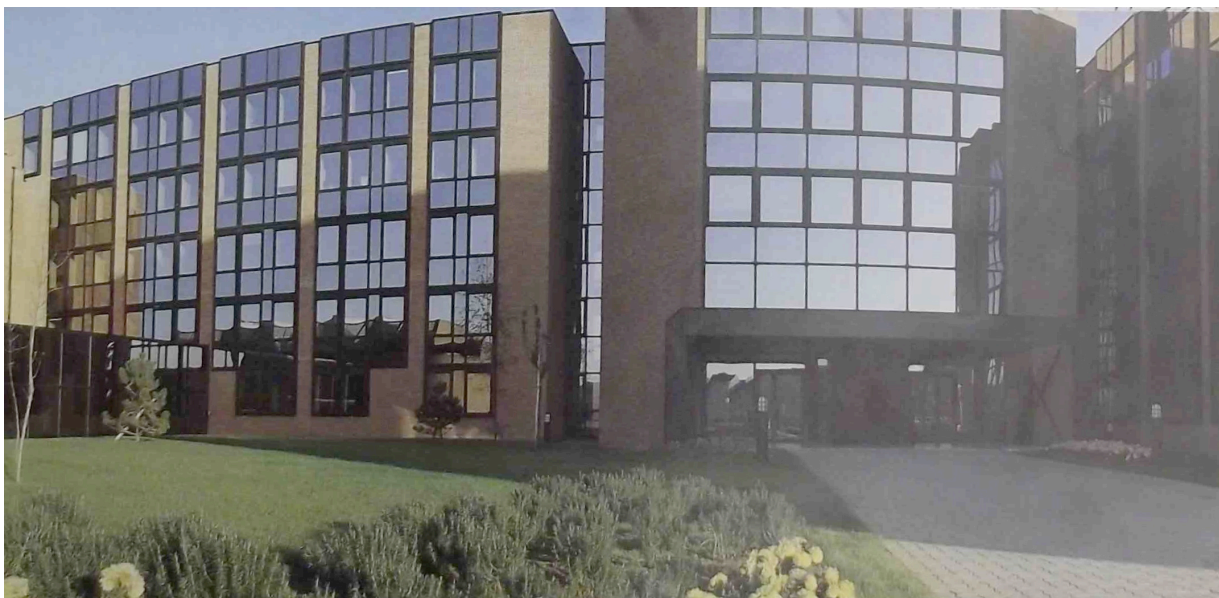
Figure 15. Nouveau siège de CDC France en 1983 à Lognes (Est de la région Parisienne).