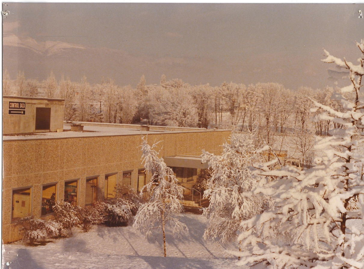
Figure 8. Usine CDC de Ferney-Voltaire vers 1975.

les matériels complets. La proximité de l'aéroport international genevois facilite la réexpédition des machines vers d'autres pays, après assemblage et check-out . Une équipe de techniciens accompagne chaque machine pour l'installer chez l'utilisateur. Les nouveaux clients développent et testent leurs applications sur les machines de Ferney, qui devient donc à son tour une vitrine commerciale.