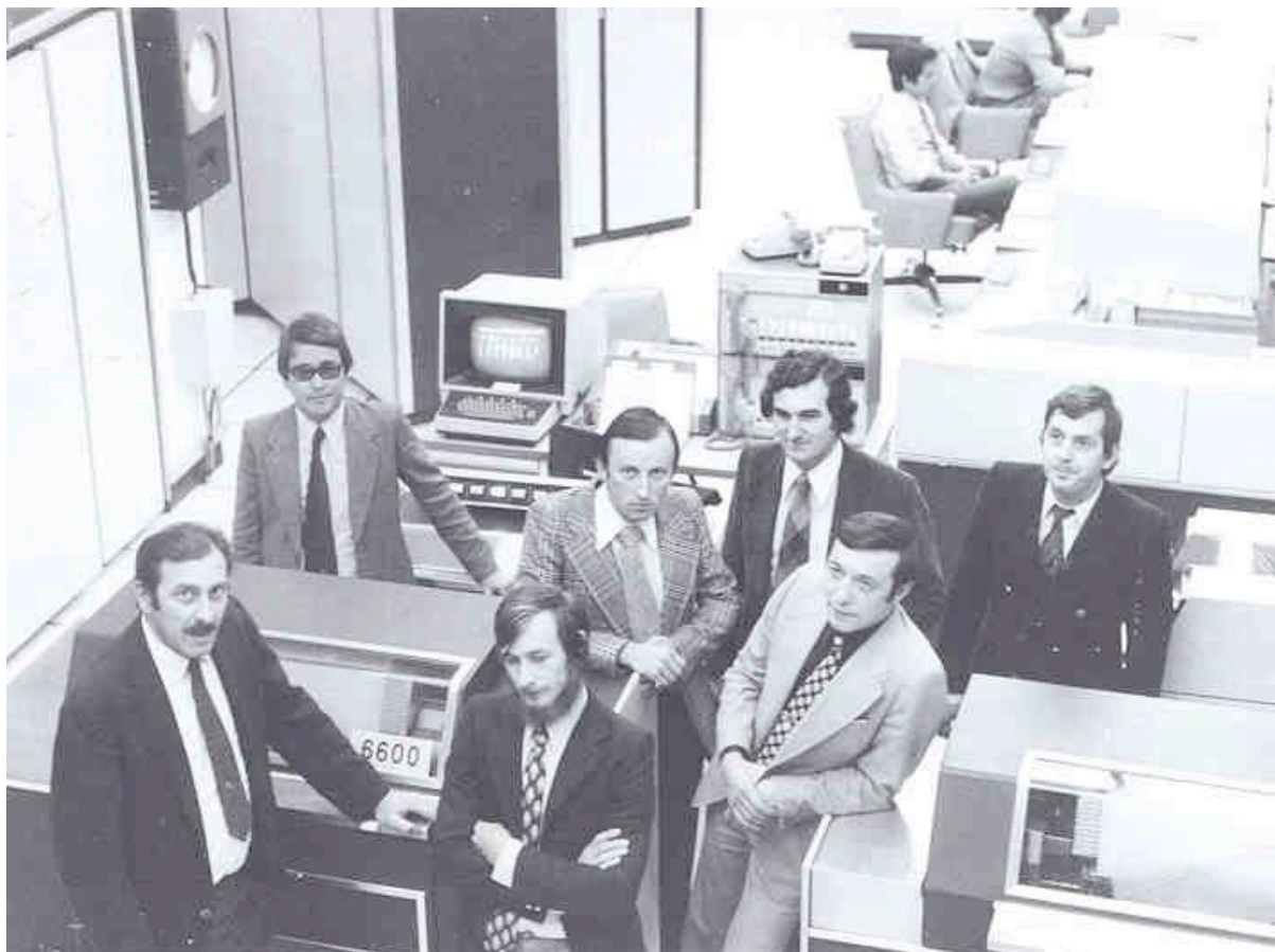
Figure 5. Au centre de calcul de la SIA : l'équipe Control Data 6600 (1971).

Des tensions apparaissent ensuite, quand CDC vend de gros ordinateurs à des clients qui avaient commencé par louer du calcul à façon à la SIA : celle-ci apprécie peu de voir cannibaliser la clientèle qu'elle avait formée à l'emploi des 3600, comme Sud-Aviation. Ce problème restera une pomme de discorde entre CDC et SIA jusqu'à la disparition de celle-ci. Mais sur tous les autres plans, les relations entre les deux firmes donnent l'impression d'un partenariat cordial entre deux firmes d'ingénieurs liées à la fois par les intérêts mutuels, par une culture professionnelle commune et par une connivence d'initiés, partageant des compétences rares dans une technologie d'avant-garde.