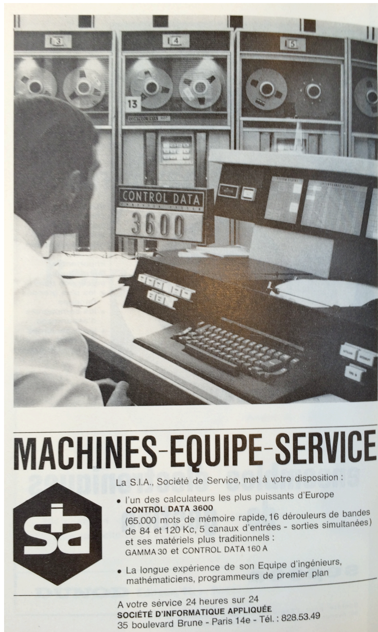
Figure 4. En 1964, la Société d'informatique appliquée (SIA) met en avant l'exceptionnelle capacité de traitement offerte par son CDC 3600. Celui-ci, le n° 7 de la série, est offert et entretenu par Control Data dans le bel immeuble de la SEMA, boulevard Brune.

D'autre part les dirigeants du groupe SEMA ont un réseau de relations exceptionnel dans la technostructure française, dont CDC peut bénéficier indirectement. Les grandes organisations ayant peu de compétences en informatique, elles demandent fréquemment conseil à la SEMA ou à ses filiales pour choisir leurs ordinateurs et les programmer.