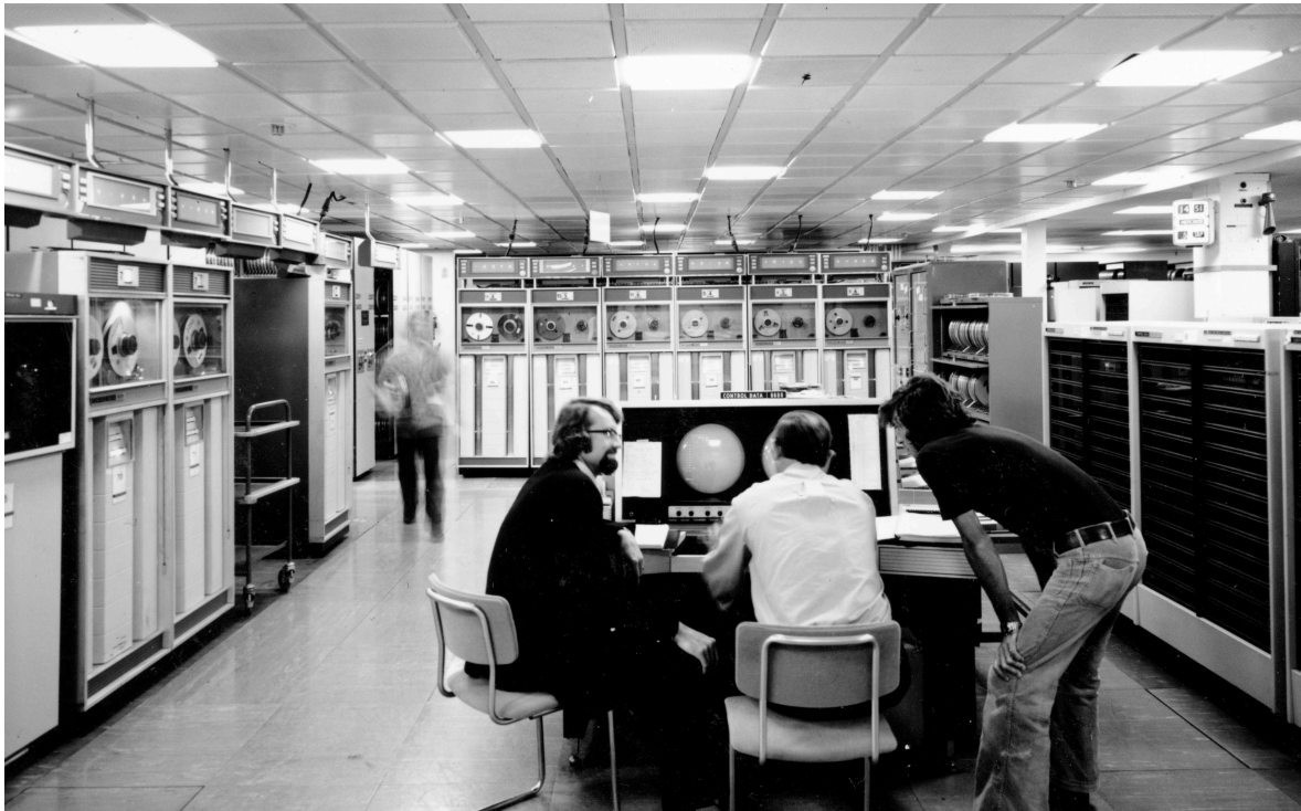
Figure 9. CDC 6600 au centre de calcul du CERN.

Chef d'œuvre de l'ingénieur logiciel Seymour Cray, cette machine originale à tous points de vue est dotée d'une capacité de traitement parallèle qui lui assure une vitesse de calcul très supérieure à tous les gros ordinateurs des années 1960. Une centaine d'exemplaires seront vendus, à un prix d'environ $ 8 M de l'époque. Ces super-calculateurs ont la puissance d'un petit micro-ordinateur d'aujourd'hui.