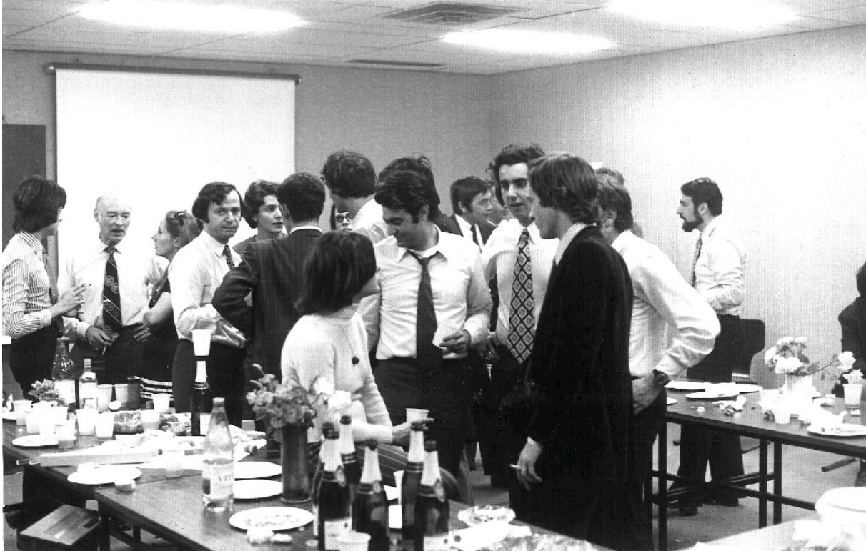
Figure 7. L'équipe parisienne du European Software Development Department de CDC au milieu des années 1970, célébrant l'aboutissement d'un projet. L'abondance des spiritueux confirme que nous ne sommes pas chez IBM. La proportion visible de quatre femmes sur dix-huit programmeurs ou analystes est normale dans la profession informatique, à l'époque.