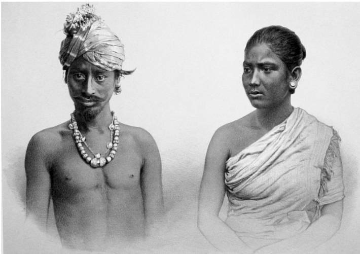
Fig. 3. « Muttuck »