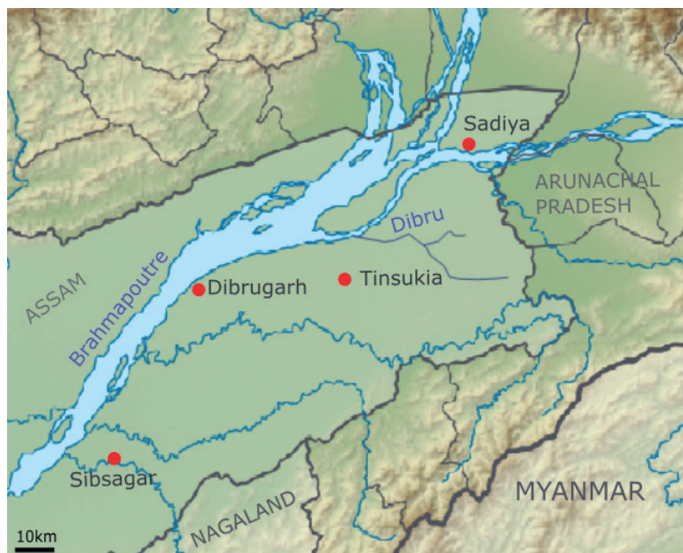
Fig. 2. Haut-Assam actuel