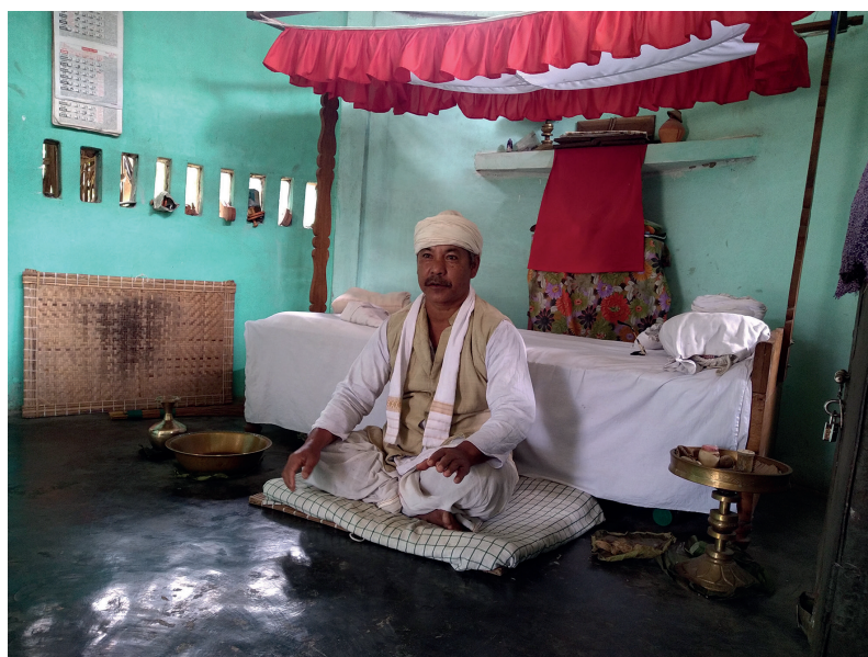
Fig. 7. Le Ubon Satra Gosain, de la lignée de Tipuk