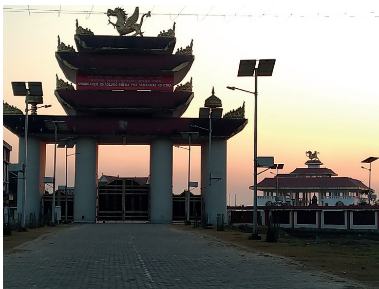
Fig. 6. Revivalisme ahom : le Mémorial de Sukhapa (Sukapha Sammanay Kshetra) inauguré en 2010 à Jorhat

Né dans la dernière décennie du XIX e siècle, avec la fondation en 1893 de la Ahom sabha , le revivalisme ahom est très actif (Saikia 2004 ; Terwiel 1996) Un nombre croissant d'habitants du Haut-Assam se revendiquent Tai, réapprennent et reconstruisent leur langue disparue, se pensent bouddhistes, multiplient les échanges avec la Thaïlande et les Shan du Myanmar et font campagne pour l'obtention du statut de Scheduled Tribe « Tai-Ahom ».