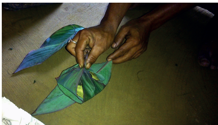
Fig. 5. Confection du tāmol-pan à la façon moran