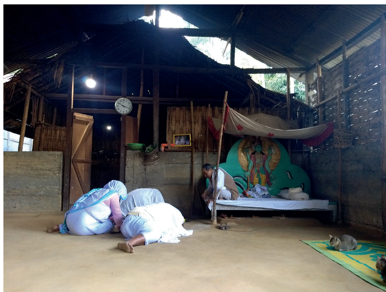
Fig. 8. Maître et disciples dans le satra de Dirak, 2019