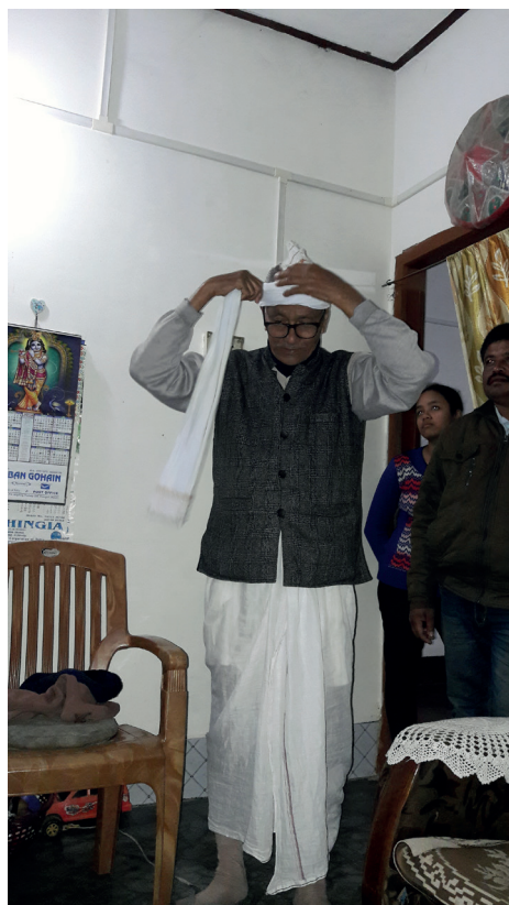
Fig. 4. Aîné matak démontrant le nouage du turban