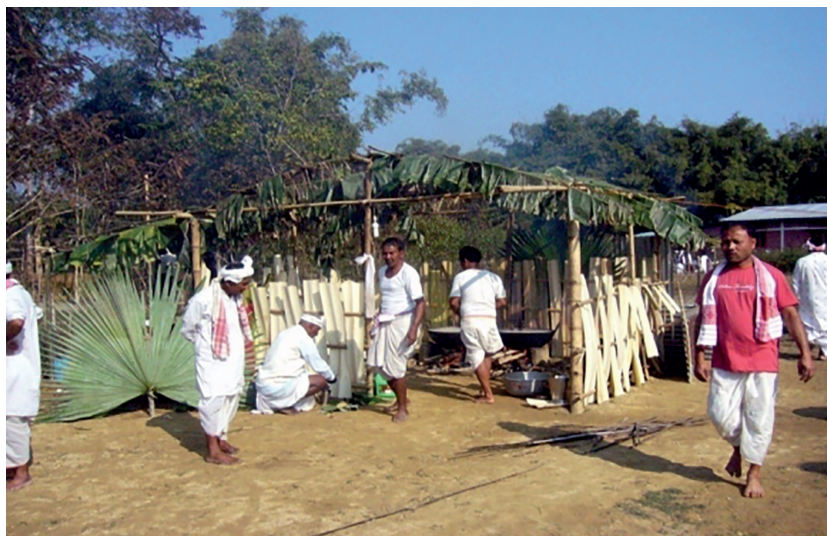
Fig. 9. Aire khalā dans un banquet de fin de deuil ( sakam )

que les plus importants des banquets ne sauraient se tenir qu'en plein air, afin d'aménager plusieurs dizaines d'aires ( khalā ), chacune abritant un collectif de commensalité dans lequel on peut voir le produit final de plusieurs processus de différenciation.