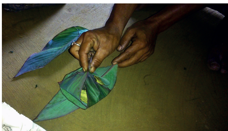
Fig. 5. Confection du tāmol-pan à la façon moran