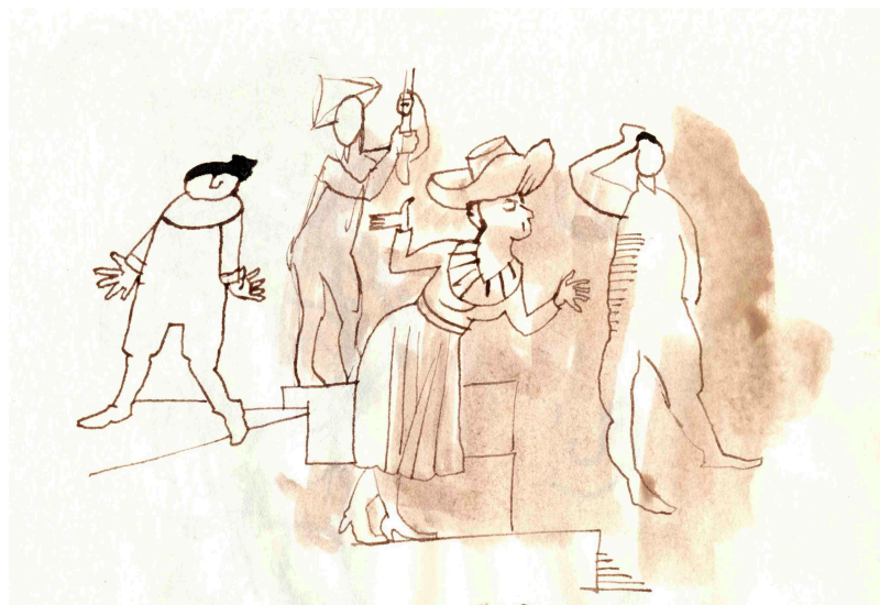
Figure 2 – Corps apprenant : co-présence, interactions, actes d'interprétation (Courtoisie de Charles Michel, dessinateur, Amsterdam NL)

position, se déplacer) qui participent à l' interprétation de l'expérience (au sens global de « comprendre », « jouer / performer » et « traduire par des signes »). Une « approche par-corps » en éducation est donc une démarche qui choisit de solliciter de façon consciente et marquée le corps apprenant, de le placer en interaction avec d'autres corps dans un espace d'apprentissage, pour l'engager dans des actes de connaissance intégrant perception, mouvement et connaissance.