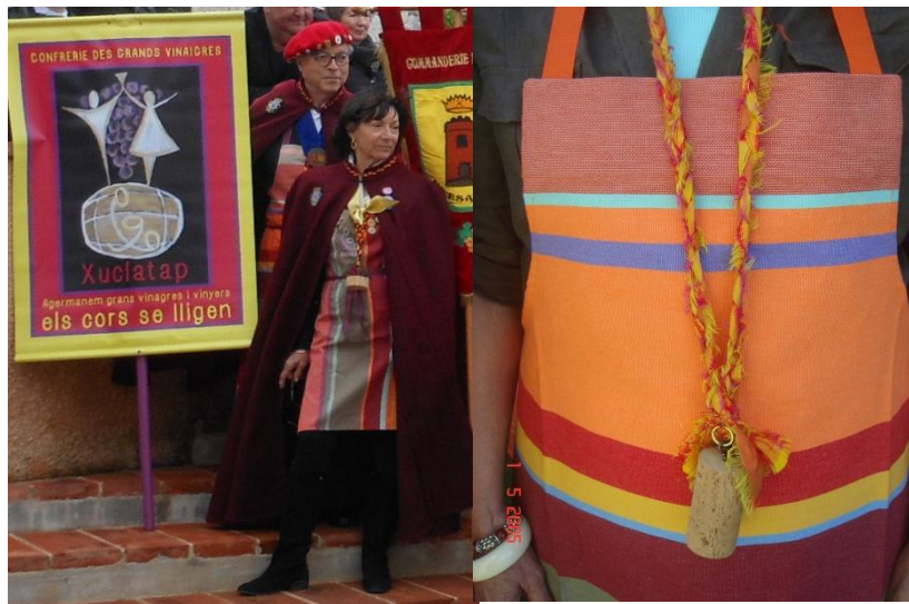
Figure 1 : Tenue de la Confrérie Xuclatap des Grands Vinaigres

Si les caractéristiques des intronisations varient d'une confrérie à l'autre, elles se composent toutes d'actions et de gestes immuables qui en constituent le rituel. La séquence du rituel d'intronisation de la Confrérie des Grumeurs de Santenay est ainsi décrite par son Grand Maître :