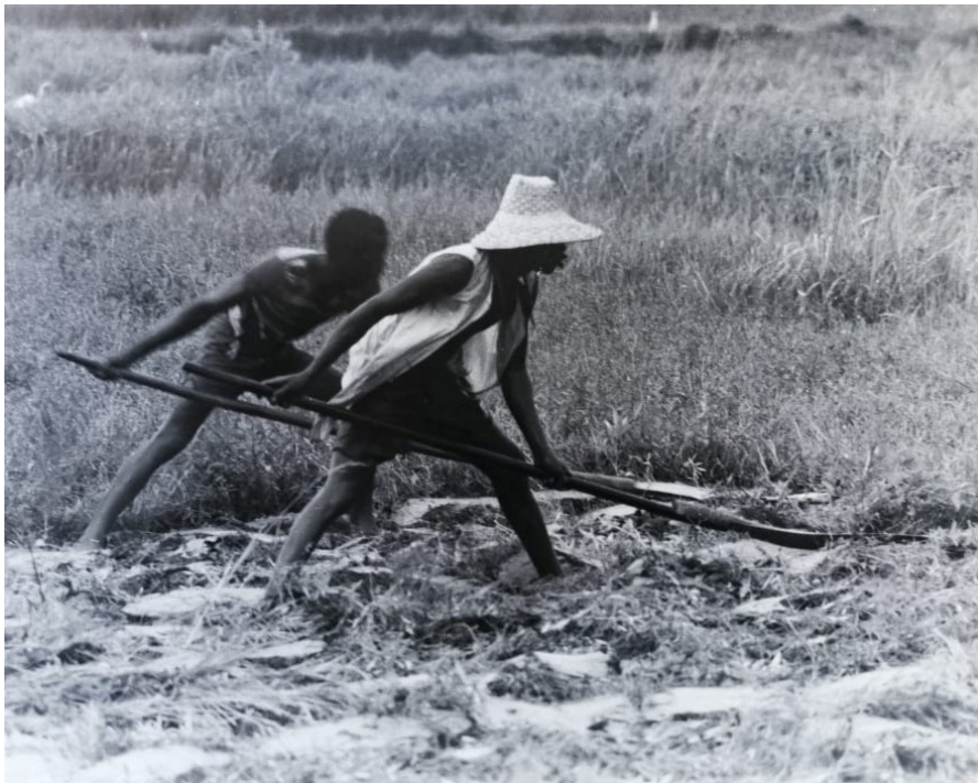
Figure 11 : Photographie de travaux agricoles au CEPI de Cufar, non datée