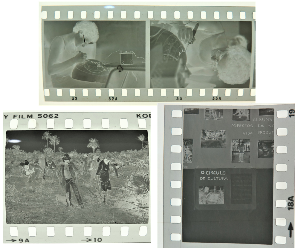
Figures 4-5-6 : Négatifs photographiques « 04-03-1977. Bissau Trabalho produtivo. n° 32-33 » ; « 21-04-1977. Sedengal (Cacheu) » ; « 14-07-1977. Aula de pesquisa. n° 7 »