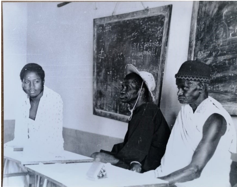
Figure 9 : Photographie d'un échange avec les détenteurs traditionnels des savoirs dans le CEPI de Cufar, non datée