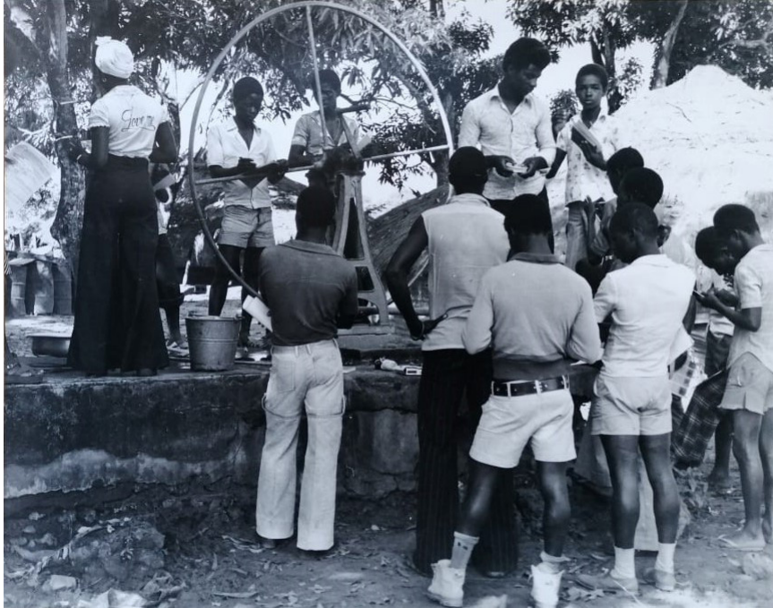
Figure 10 : Photographie de la construction d'un puits au CEPI de Cufar, non datée