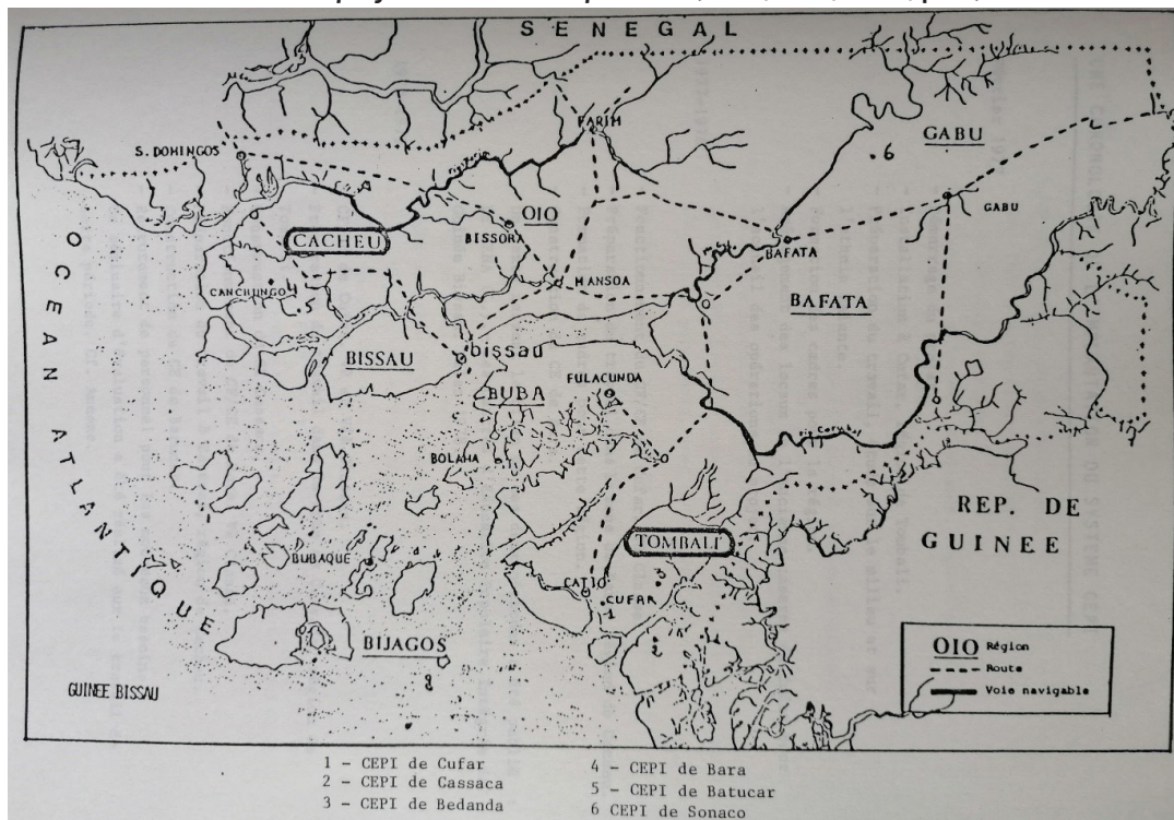
Figure 8 : Luiz de Sena, Création de Centres d'éducation populaire intégrée (CEPI) en Guinée-Bissau. Situation du projet en 1980. Perspectives (Paris, INEP, 1981, p. 6)