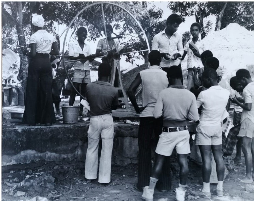
Figure 10 : Photographie de la construction d'un puits au CEPI de Cufar, non datée