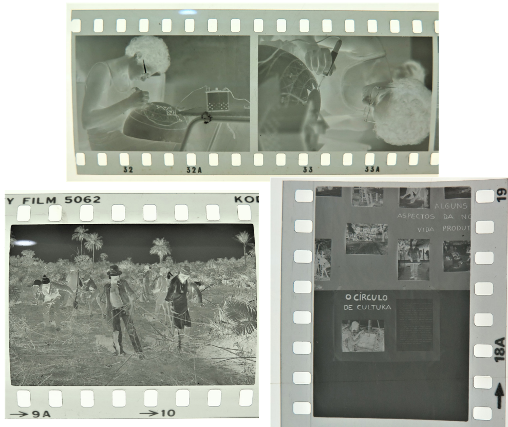
Figures 4-5-6 : Négatifs photographiques « 04-03-1977. Bissau Trabalho produtivo. n° 32-33 » ; « 21-04-1977. Sedengal (Cacheu) » ; « 14-07-1977. Aula de pesquisa. n° 7 »