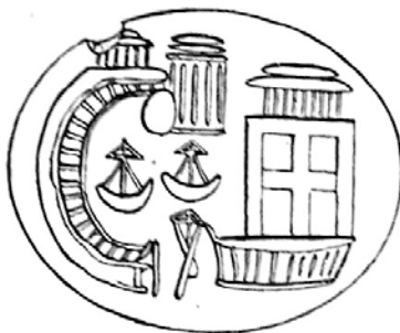
Fig. 3 : D'après Raymond Lantier, « Intaille représentant un port », Bulletin de la Société Nationale des Antiquaires de France , 1922, p. 293.

Un second exemple nous est fourni par une intaille trouvée à Carthage, probablement datée du Bas-Empire (Fig. 3). Son décor gravé au plat délimite le tracé semi-circulaire d'un port, situé à gauche de la représentation 36 . Cette seconde convention est relativement fréquente dans les représentations portuaires romaines : l'emploi du demi-cercle matérialise la forme générale du bassin portuaire 37 . On le distingue sur plusieurs documents africains : sur la mosaïque de « la Régate des Amours » à Lepcis Magna, sur le décor d'une lampe carthaginoise 38 et enfin sur une peinture de la « Maison des Nymphes » à Neapolis (Nabeul, Tunisie) 39 .