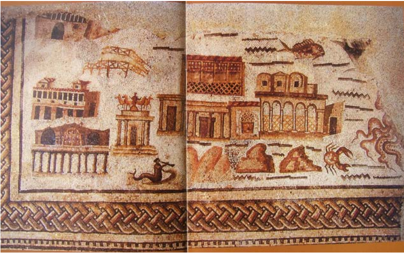
Fig. 1 : Mosaïque de « la vue du port d'Hippone » depuis la mer (l. 2,70 m), conservée au Musée d'Annaba (d'après C. Boulinguez & J. Napoli, 2008, p. 705).

l'entrée du port. Il s'inspire, de toute évidence, des statues de tritons positionnées sur les quatre angles du premier étage du phare d'Alexandrie. Il demeure l'unique phare du monde antique à arborer de telles figures mythologiques, dont on a montré qu'elles étaient en lien avec la navigation 17 . Leur rôle bienfaiteur à l'égard des navigateurs se traduisait par leur fonction de signal sonore et, entre autres, de corne de brume.