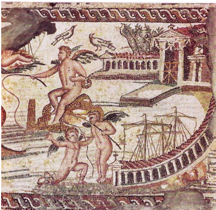
Fig. 2 : Mosaique de « la Régate des Amours », Villa du Nil, Lepcis Magna, conservée au Musée de Tripoli (d'après https://vici.org/image.php?id=2013 , cliché de René Voorburg sous licence Creative Commons).

port situé à droite de la scène (Fig. 2). Deux Amours chevauchent un dauphin, tandis qu'un autre est grimpé sur une amphore. On y retrouve le motif alexandrin du « pauvre pêcheur » assis au centre, sur un rocher. L'ambiance bucolique (paniers emplis de fleurs et de fruits) et la facétie du tableau permettent d'affirmer, selon Salvatore Aurigemma, que la scène comme le sujet, s'inspirent de l'art alexandrin 19 .