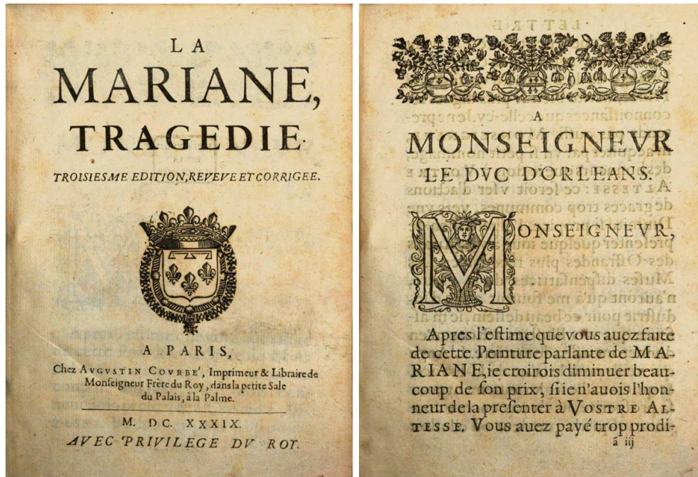
Fig. 1. Tristan L'Hermite, La Mariane , Paris, Augustin Courbé, 1639, titre gravé (à gauche) et dédicace (à droite). Bayerische Staatsbibliothek München, 4 P.o.gall. 158, urn:nbn:de:bvb:12-bsb10056113-0.

https://www.digitale-sammlungen.de/en/view/bsb10056113?page=3