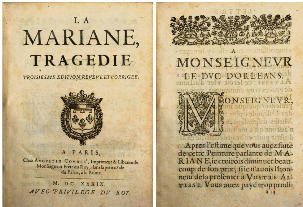
Fig. 1. Tristan L'Hermite, La Mariane , Paris, Augustin Courbé, 1639, titre gravé (à gauche) et dédicace (à droite). Bayerische Staatsbibliothek München, 4 P.o.gall. 158, urn:nbn:de:bvb:12-bsb10056113-0.

https://www.digitale-sammlungen.de/en/view/bsb10056113?page=3