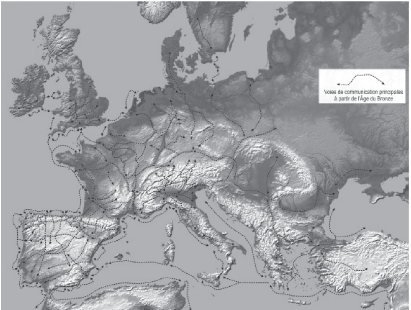
Fig. 2. Les voies principales en Europe centrale et occidentale à l'âge du Fer, terrestres et maritimes (Moya-Maleno & Torres-Martínez, 2011).