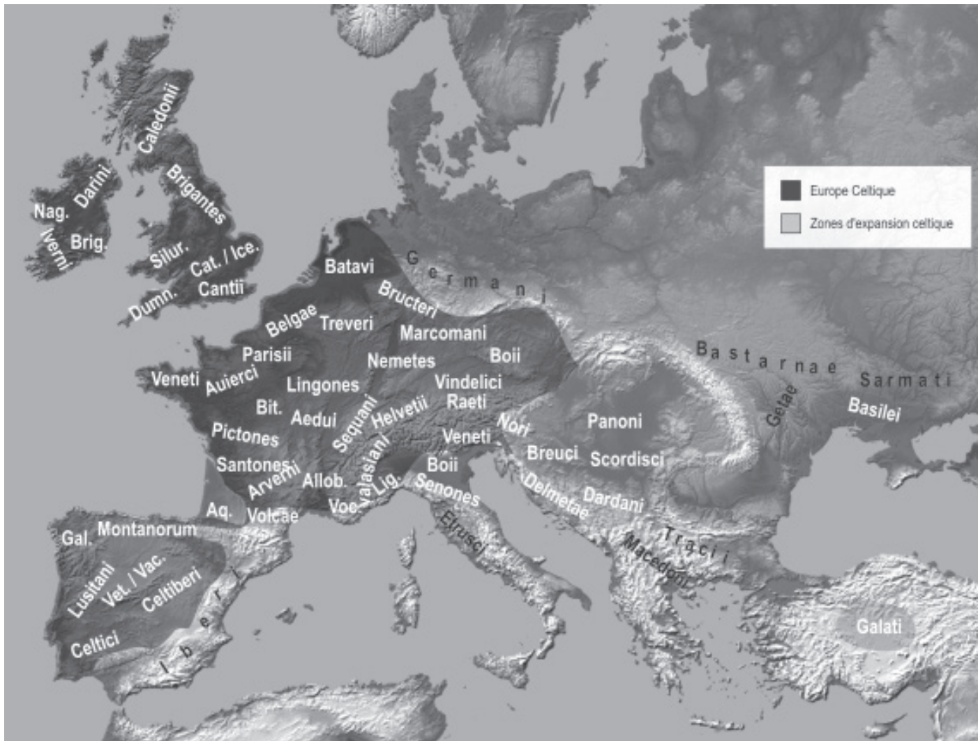
Fig. 1. Les peuples d'Europe centrale et occidentale au Second âge du Fer (Moya-Maleno & Torres-Martínez 2011).