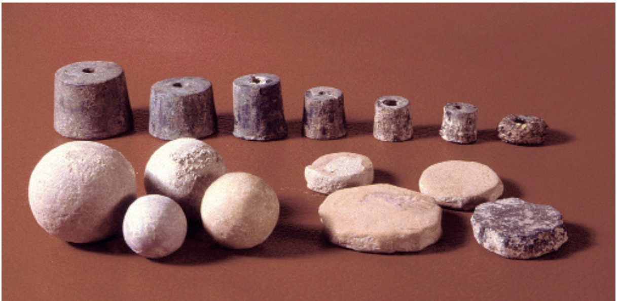
Fig. 4. Ensemble de poids de La Hoya (A. Llanos).

D'autre part, les poids en bronze et en fer retrouvés dans les villages de La Hoya (Laguardia, Alava), La Custodia (Viana, Navarre) et Munoaundi (Azpeitia-Azkoitia, Guipúzcoa) nous donnent une idée des transactions commerciales, sans doute de moindre envergure mais visiblement de grande importance pour le développement de ces communautés. Sur le premier des sites, on a découvert un ensemble de poids dans l'une des habitations du village à laquelle on a attribué une fonction d'échoppe car elle contenait plusieurs objets produits en série. L'ensemble en question était formé de six poids tronconiques en bronze et d'un poids discoïdal en fer (fig. 4). Ils présentent tous un trou rond au milieu pour être montés sur une tige et sont gravés sur leur face supérieure de fines incisions linéaires liées à la valeur de chacun d'eux. Dans le village de La Custodia ont été mises au jour quatre pièces en bronze correspondant à différents poids 8 ; deux d'entre elles présentent des formes tronconiques et une surface annelée, la troisième possède une forme cylindrique, tandis que la quatrième