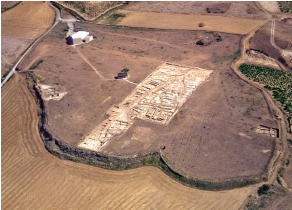
Fig. 2. Vue aérienne du village de La Hoya (Laguardia, Araba) (A. Llanos).

Un autre parallèle peut être fait avec les récipients polypodes qui, s'ils ne sont pas exactement identiques, présentent en revanche cette caractéristique. Nous faisons allusion à ceux localisés dans les niveaux du Bronze final-Premier âge du Fer, du village de La Hoya (Laguardia, Alava) (fig. 2), aux surfaces décorées de cordons digités.