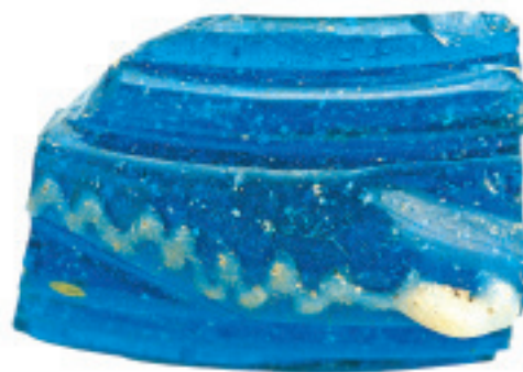
Fig. 3. Fragment de bracelet de Basagain (Anoeta, Guipúzcoa) (Lamia).

Hormis les ensembles céramiques mentionnés, nous disposons en Euskal Herria – Pays Basque d'autres éléments qui évoquent directement les relations commerciales qui pourraient avoir existé entre quelques villages fortifiés de ce territoire et des lieux plus ou moins éloignés du continent européen. Ainsi, on a localisé dans le village de Basagain (Anoeta, Guipúzcoa) un fragment de bracelet en verre bleu à filet blanc (fig. 3), qui nous place dans le cas d'un commerce à longue distance, probablement avec la région méditerranéenne française, à une date précédant le changement d'ère.