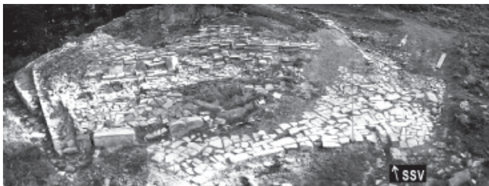
Fig. 6. Sanctuaire de Gastiburu (Arratzu, Biscaye), lobe N (L.Valdés).

Le fait que Gastiburu soit un lieu où l'on fixe des repères solsticiaux est intéressant, car il s'agit du premier lieu découvert dans notre territoire où s'exerce cette fonction. Bien que ce soit une connaissance constatée depuis le Néolithique en Europe, il n'en existait pas de preuve archéologique dans le Golfe de Gascogne Oriental et les Pyrénées occidentales 12 .