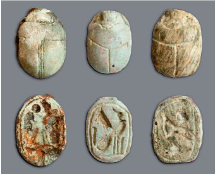
Fig. 5. Scarabées égyptiennes localisés dans la nécropole de El Castillo (Castejón, Navarre) (Almagro & Graells 2011).

segments et les plans en forme de fer à cheval montrent une planification de la forme et du processus de construction. Si l'architecture du Second âge du Fer connaît un certain usage de règles et systèmes de mesure, les constructions, elles, tendent à être rectilignes face à la prédominance de la courbe à Gastiburu (fig. 6). Le développement géométrique des proportions a permis d'étudier le module sur lequel repose le système. La forme générale rappelle la décoration curviligne de l'art celtique. Les bornes-stèles connues dans le territoire d'Euskal Herria - Pays Basque, aux motifs d'étoile, confirment les relations nord-pyrénéennes.