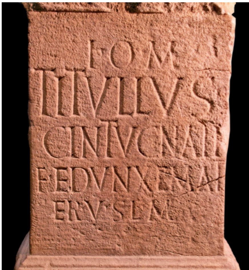
Fig. 3. Autel votif à Jupiter provenant d'Arnesp, dédié par un couple mixte du point de vue ethnologique. (Musée Saint-Raymond de Toulouse ; cl. J.G.).

ou bien ont changé de tradition, de l'aquitain au gaulois, par exemple, au cours d'une génération ( Dannonia Harspi filia , CIL, XIII, 118 : Ardèche), ou du gaulois à l'aquitain, comme on le voit dans plusieurs inscriptions : Hannaro Dannorigis f. (CIL, XIII, 5 : Saint-Lizier), Anderexso Condannossi f. (CIL, XIII, 324 : Caubous), Silex Eppamaigi f. (CIL, XIII, 11011 : Saint Bertrand-de-Comminges) ; dans ce dernier cas, tous les noms de la génération suivante sont aquitains ( Odox(us) , Lohitton , Andosten et Andossus ), décision favorisée sûrement par le fait que Silex a épousé un homme appartenant à une famille aquitaine Borsus Adeili f.