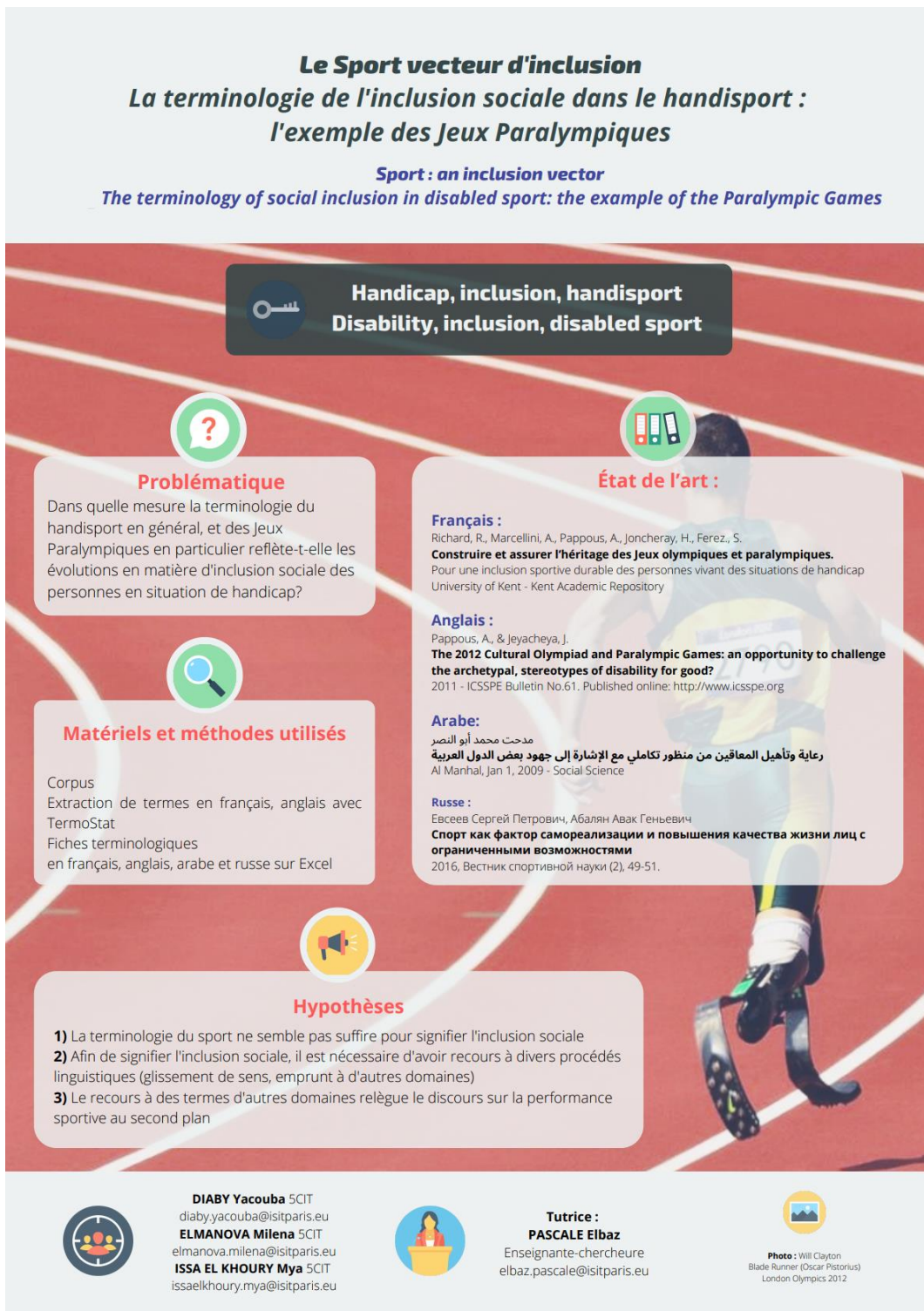
Figure 3 Poster réalisé par Yacouba Diaby, Milena Elmanova et Mya Issa El Houry (2019)