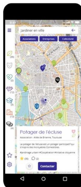
Figure 2 : Application CityConnect de mise en relation contextualisée usager-service

Cette analyse met en évidence l'absence de dispositif semblable à BL.Conecta fédérant aussi largement les services d'un usager du territoire, conférant de fait une place prépondérante à notre prototype sur le marché public : en bénéficiant d'une externalité d'offres, l'augmentation du nombre de producteurs présents sur la plateforme pourra accroître le nombre de services proposés, maximisant l'attrait pour les utilisateurs consommateurs. Pour ce faire, nous avons développé un premier outil (cf. Figure 2) qui met en contact producteurs et utilisateurs de services et leur fournit l'interface technologique facilitant les interactions (Belleflamme, Peitz, 2018).