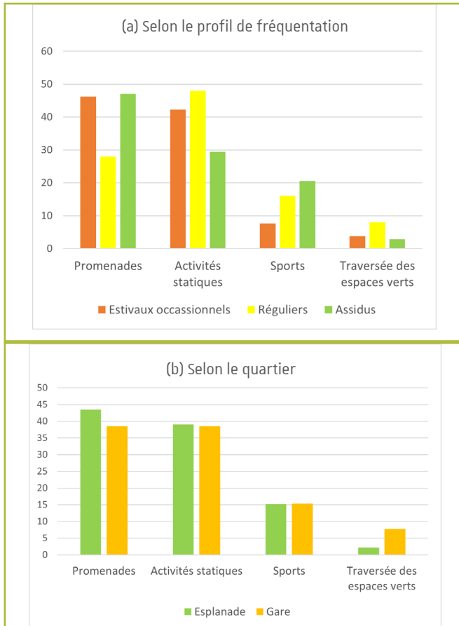
Figure 4 Pratiques d'activités dans les espaces verts

cours des entretiens avec les acteurs des centres socio-culturels qui proposent aux résidents des quartiers de plus en plus d'activités physiques modérées dans les espaces verts de proximité. D'autres leviers pour encourager la pratique physique en déployant des équipements ou en s'appuyant sur les tracés des Vitaboucles (Circuits d'activité physique proposés par l'Eurométropole), peuvent également être réfléchis en