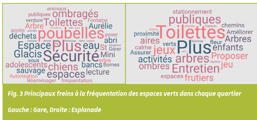
Fig. 3 Principaux freins à la fréquentation des espaces verts dans chaque quartier

de la Gare, des craintes fondées sur un sentiment d'insécurité (routière, présence de certains publics) ou des conflits d'usage entre les différents publics des espaces verts (familles / adolescents, groupement d'hommes / consommateur d'alcool / de drogues) freinent fortement la venue des habitants du quartier dans ces espaces. Des solutions sont cependant envisageables autour de la dotation du quartier Gare d'un véritable parc de proximité à partir d'un réaménagement interne et des abords permettant de faciliter l'accès au parc du Glacis ou la création de véritables espaces verts éphémères sur la voirie qui à termes pourrait se pérenniser et homogénéiser la répartition des espaces verts dans le quartier. Outre ces aménagements lourds, il est également possible de jouer sur la complémentarité des espaces verts et places publiques par exemple, avec une éventuelle spécialisation des activités dans ces lieux à des moments particuliers de la journée ou de la semaine.