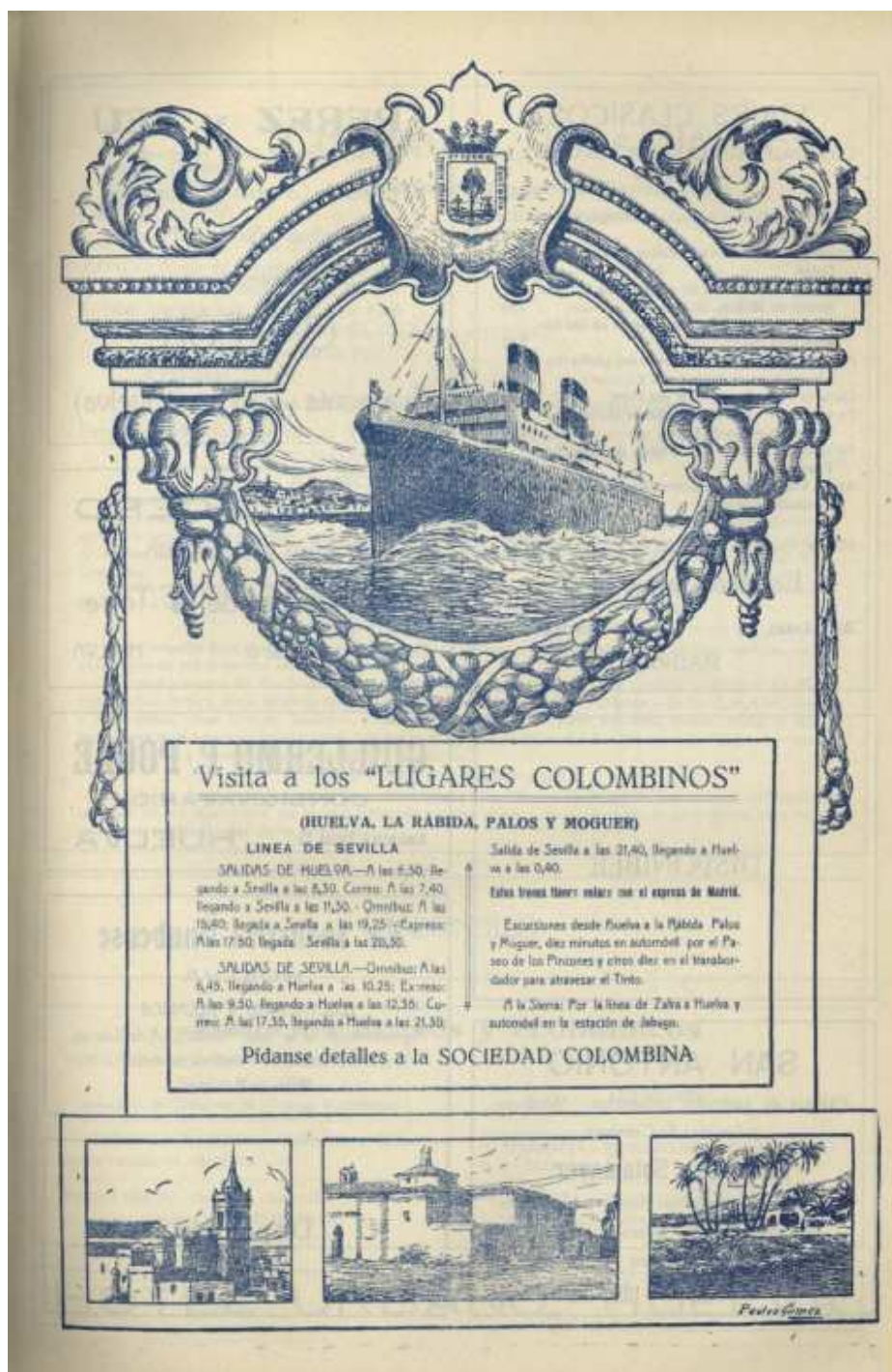
Figura 4: Cartel promocional producido por la Real Sociedad Colombina Onubense 33

principales capitales de provincia 32 se encontraban representadas en una iniciativa que ilustraba las conexiones entre turismo, americanismo y élites de poder.