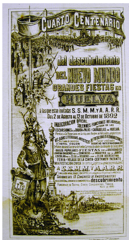
Figura 2: Cartel anunciador de las “Grandes Fiestas en Huelva” de 1892 19