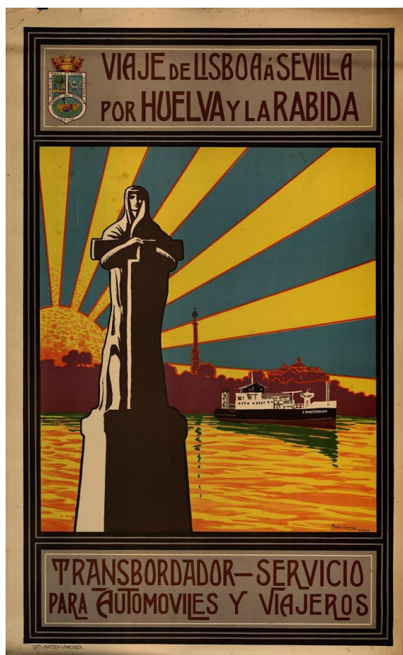
Figura 5: En primer y segundo plano, el Monumento a la Fe Descubridora y la Punta del Sebo 52

el famoso Muelle de las Carabelas, de donde partieron las carabelas con marineros de los puertos de Palos y Moguer, hoy día uno de los sitios culturales más visitados de Andalucía 51 . Allí la casa natal de Martín Alonso Pinzón, que se convertiría en museo en 1969, o el Gran Hotel Colón (hoy Casa Colón), lujoso establecimiento edificado en 1883 que acogió parte de los festejos de 1892. Allí también la Columna del IV Centenario, dedicada a los “descubridores de América”, de una altura de 55 metros y rematada por una corona y un globo terráqueo con una cruz. Sitios llamados a convertirse en duraderos lugares de la memoria colonial, cuya función conmemorativa se vería confortada en los años siguientes: en ese mismo lugar serían elevados en 1929 (año de inauguración de la Exposición Iberoamericana de Sevilla) el Monumento a la Fe Descubridora, cuya composición formal convertía a Colón en un austero misionero al servicio de la Cristiandad, y el Monumento al Plus Ultra, conmemorativo de la travesía aérea del Atlántico Sur realizada en 1926 por el hidroavión homónimo, motivo de singular orgullo para la España primorriverista.