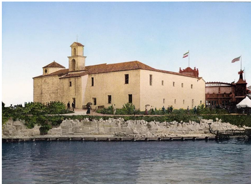
Figura 1: Fotografía del monasterio de la Rábida en la Exposición de Chicago 18