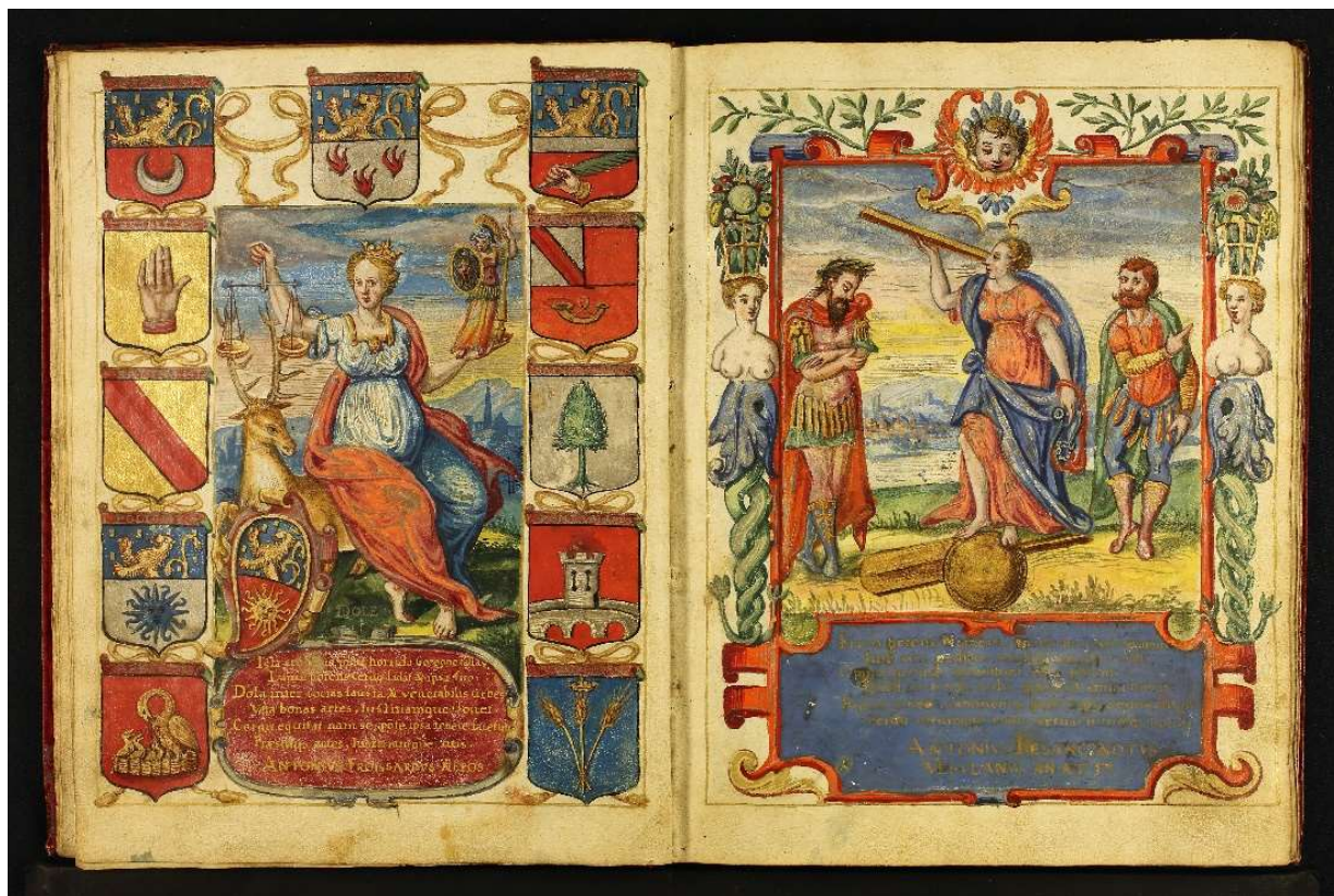
Illustration 2 : [Collège des jésuites de Dole]. [Recueil de compliments en vers [...] adressés à Jean Froissard], 1593, manuscrit. Représentations de Dole prenant appui sur les Froissard, de Némésis tenant le joug, f. 5 verso et 6 recto. Médiathèque du Grand Dole, cote 16MS/M/7.