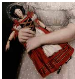
Figure 4 | Théodore Chassériau, La Poupée .

La poupée représentée sur ce tableau date de toute évidence des années 1830. Elle devait avoir une tête - ainsi que les avant-bras et les jambes - en papier mâché, assemblée sur un corps en toile bourrée ou en cuir. De provenance allemande, elle fut probablement fabriquée par Andreas Volt à Hildburghausen, en Thuringe 8 .