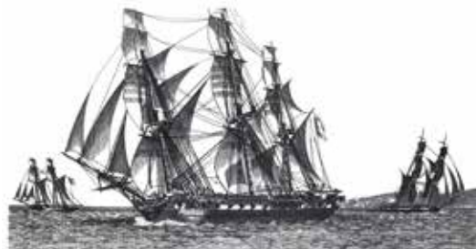
Figure 6 | Frégate française la Méduse . Elle fit naufrage le 2 juillet 1816 au large des côtes de l'actuelle Mauritanie, entraînant la mort de 160 personnes, dont 147 abandonnées sur un radeau de fortune. Ce naufrage causa un scandale retentissant en France au début de la Restauration. Il fut illustré par un tableau célèbre de Théodore Géricault exposé en 1819 : Le Radeau de La Méduse .

année au Mexique de fonds importants légués par l'Espagne à la France. Deux ouvrages publiés sous son nom firent autorité à l'époque : Aperçu des États-Unis au commencement du 19 e siècle (1814) et Théorie des gouvernements (1823). Selon l'histoire familiale, le baron Félix de Beaujour fit la connaissance de la famille du marquis Louis de Nayve lors de leur retour de Saint-Domingue vers la France en 1810 sur le navire la Méduse