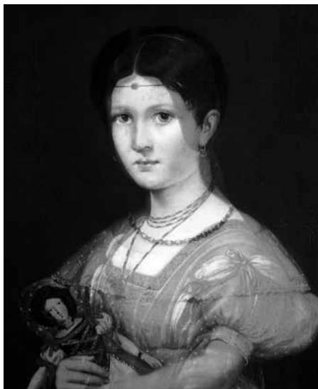
Figure 13 | Superposition/transparence l'Enfant & la poupée de Théodore Chassériau et la Belle Ferronnière de Léonard de Vinci.

Suivant les canons de l'époque, l'influence des maîtres italiens de la Renaissance est nettement perceptible dans cette représentation. Comme pour le portrait de sa soeur Aline réalisé l'année d'avant, sa trame s'inspire directement des portraits peints par Léonard de Vinci à la fin du quattrocento.