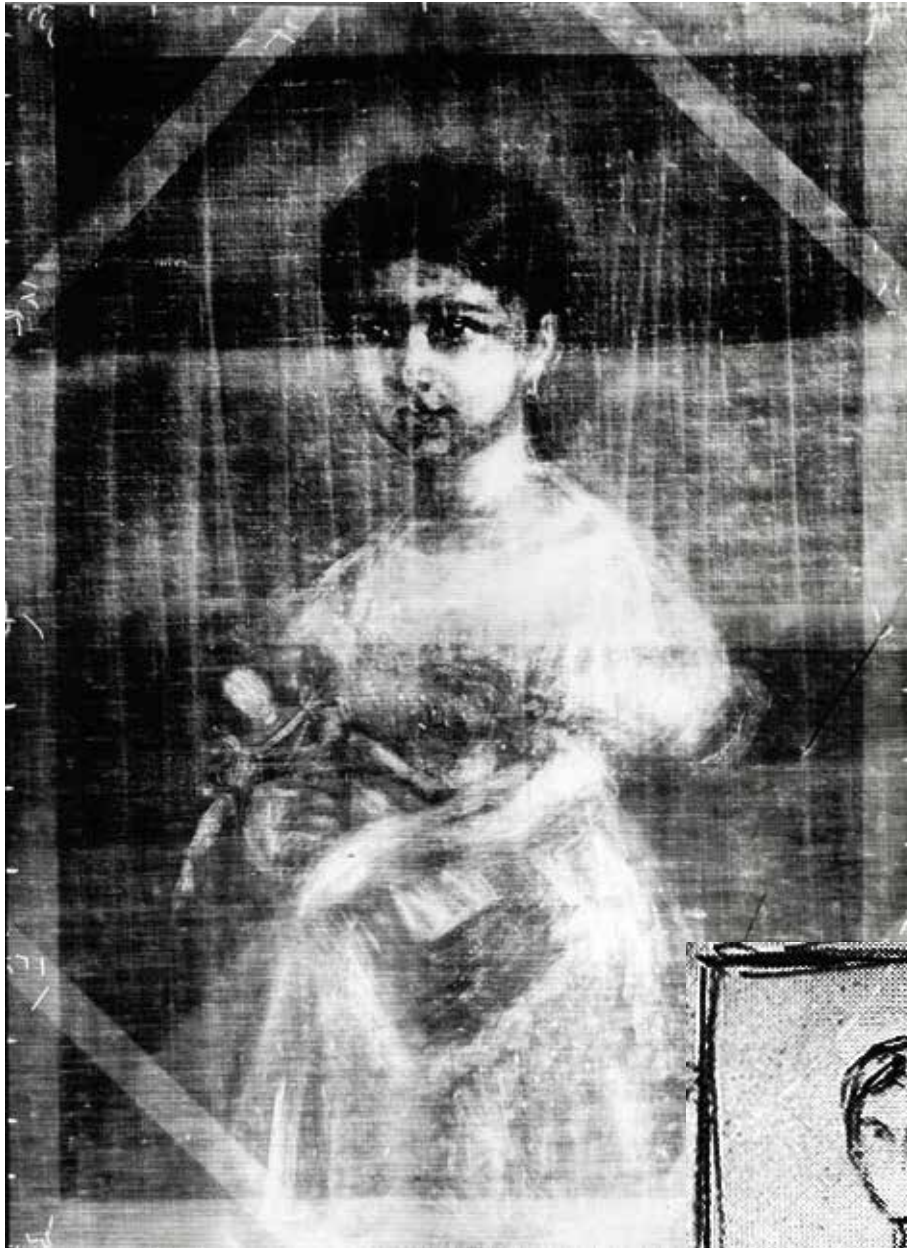
Figure 1 | Dessin sous-jacent de l'Enfant & la poupée de Théodore Chassériau (mine de plomb révélée aux rayons X).