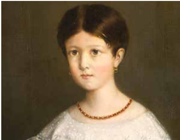
Figure 10 | Théodore Chassériau, L'Enfant et sa parure d'ambre .

l'argent, les empires du Soleil et de la Lune, le chaud et le froid. On lui prêtait autrefois le pouvoir de chasser les esprits malins, et plus prosaïquement celui de protéger de la maladie 7 .