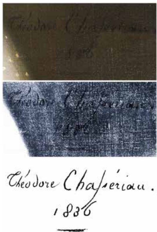
Figure 3 | Identification et extraction de la signature et de l'année d'exécution de L'Enfant & la poupée de Théodore Chassériau à partir d'une photographie infrarouge (IR2) réalisée à l'IACC de Paris.

« Portrait d'une petite fille à la poupée, signé et daté à droite Théodore Chassériau / 1836 », venant ainsi - tel un « chaînon manquant » - compléter la liste officielle des œuvres dites « de jeunesse » du peintre romantique disparu prématurément à l'âge de 37 ans 6 .