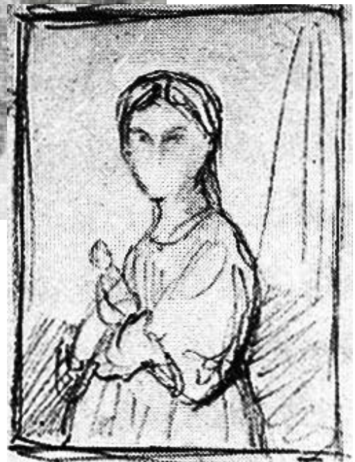
Figure 2 | Théodore Chassériau, croquis préparatoire de l'Enfant & la Poupée .