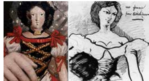
Figure 9 | « L'Idéal moderne » : La Poupée de Théodore Chassériau et Une femme pour Asselineau de Charles Baudelaire.

Il s'en dégage un charme et une grâce étrange. C'est aux univers des poètes Gérard de Nerval, Charles Baudelaire et Théophile Gautier que l'on pense en contemplant cette représentation enfantine ô combien féminine : le palimpseste des Souvenirs du Valois de Gérard de Nerval où les thèmes de l'enfance et du folklore se confondent, les correspondances de Charles Baudelaire où « les parfums, les couleurs et les sons se répondent » 13 et, finalement, l'exercice de style du poète impeccable, Théophile Gautier, sur le thème de « l'Idéal moderne », là où modernité rime avec beauté et féminité. Quoi de plus normal lorsque l'on sait les liens étroits d'amitié et de communion qui à cette époque unissaient Théodore Chassériau à Théophile Gautier, d'une part, et Théophile Gautier à Gérard de Nerval et Charles Baudelaire, d'autre part 7 .