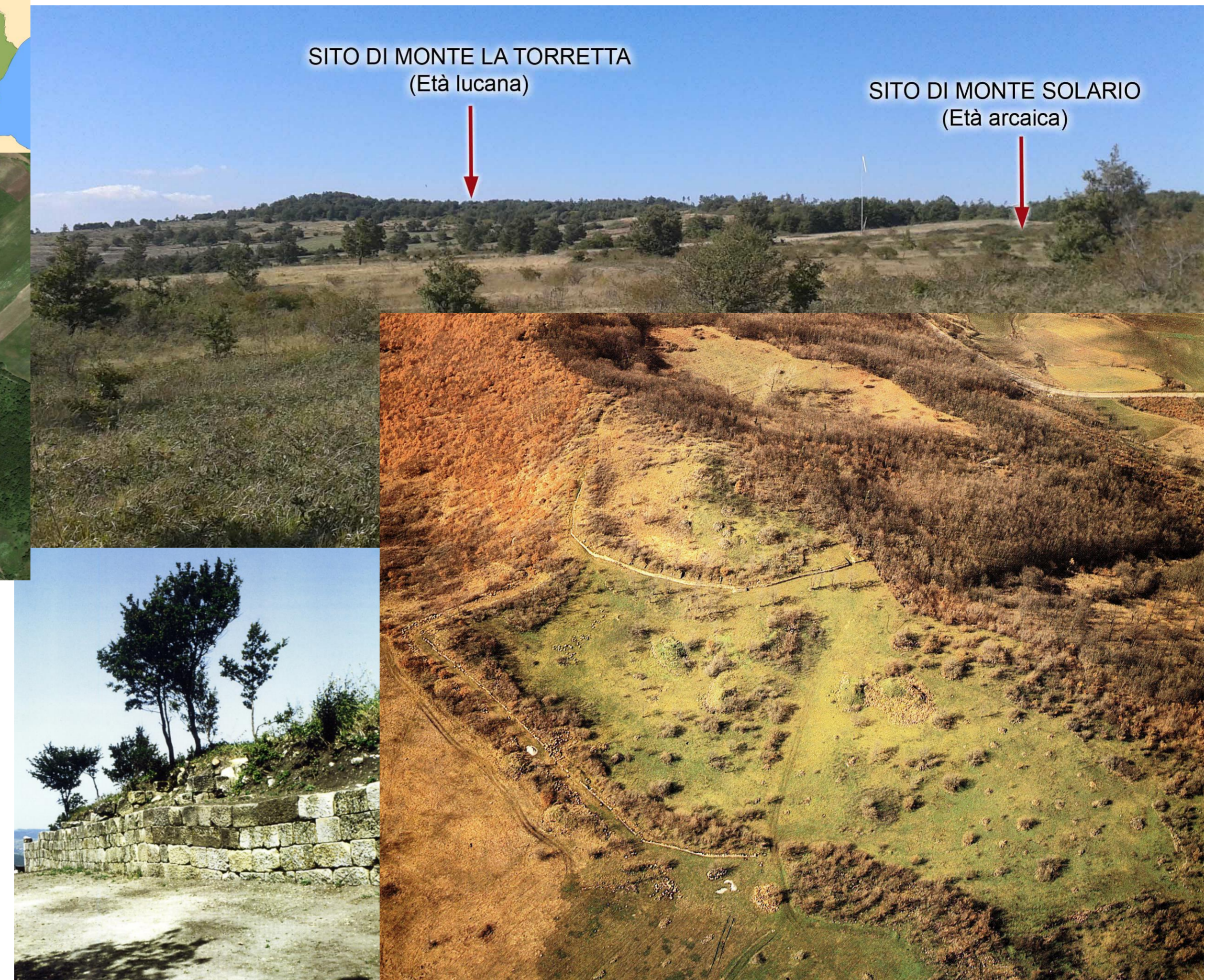
Fig. 2 – Il sistema collinare visto da sud; foto aerea di Monte Torretta e dettaglio della fortificazione lucana

Incrociando dossier recenti e passati, un primo dato essenziale, già verificato anche per il vicino sito di Serra del Carpine a Cancellara, è rappresentato da una sostanziale continuità topografica fra l'epoca alto-arcaica e la metà (almeno) del III sec. Come noto per altri siti del comprensorio c.d. nord-lucano, per l'età arcaica sembra potersi ricostruire un abitato policentrico, con piccoli villaggi di capanne e relative necropoli, dislocati alle pendici e sul pianoro di Monte Solario (fig. 1, in verde) ma anche, come attestano i rinvenimenti degli anni Sessanta, alle pendici sud di Monte Torretta, nei pressi immediati della successiva linea difensiva. Dai pochissimi dati in nostro possesso l'insediamento deve essere stato segnato da strutture di modesto impegno architettonico e con copertura straminea. In tal senso l'unica eccezione è un'antefissa rinvenuta all'interno della futura fortificazione: il manufatto, datato da Adamesteanu fra fine VI e inizio V e da lui considerato un'elaborazione grottesca di tradizione ellenistica, piuttosto che rinviare all'esistenza di un "tempio", come ipotizzato al momento dello scavo, deve essere appartenuto ad una struttura più imponente delle precedenti, con un tetto in terracotta forse non dissimile da quelli molto meglio noti per quest'epoca dalla vicina Serra di Vaglio.