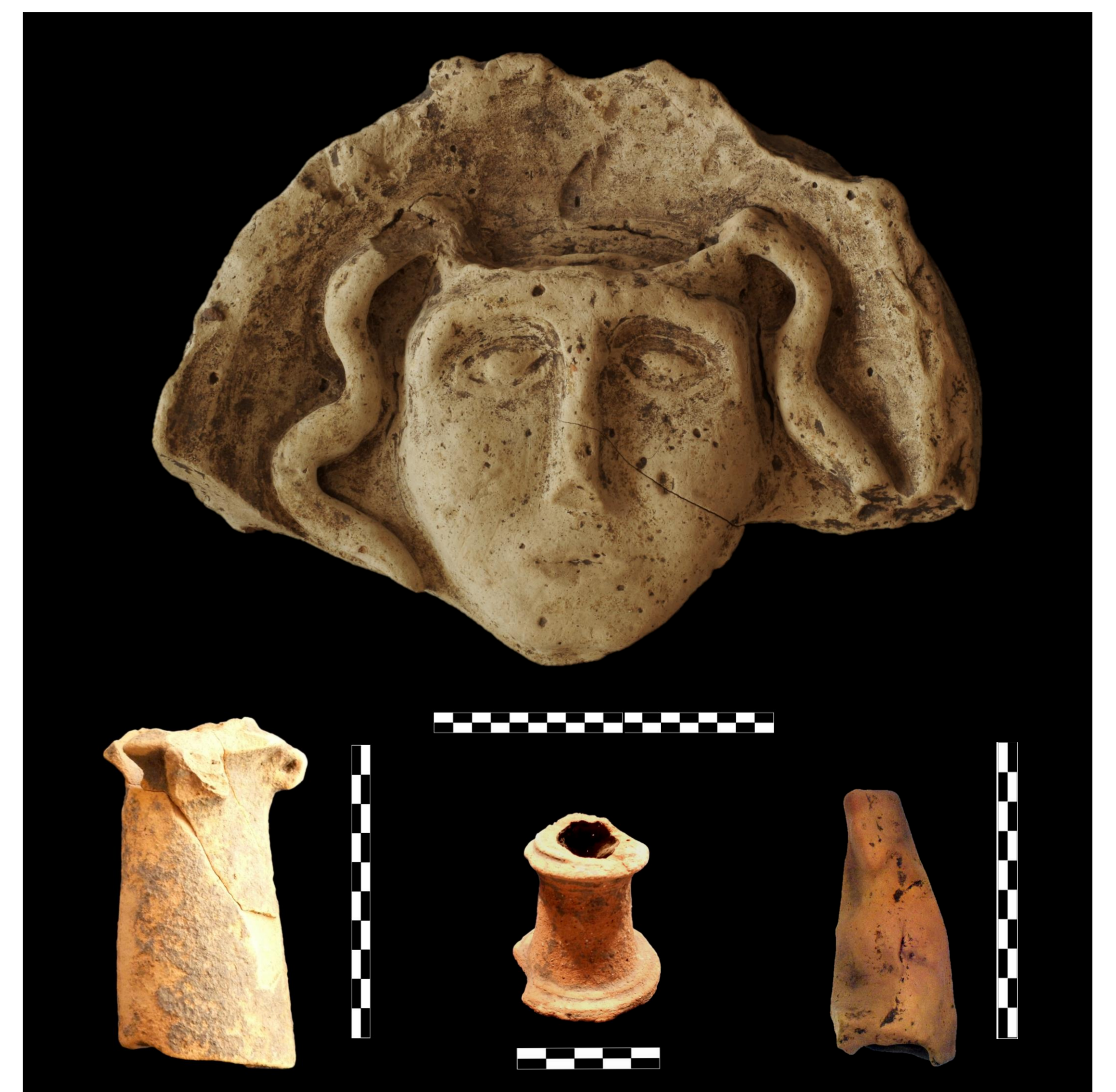
Fig. 4 – Acroterio a testa di Medusa dalla cinta esterna; thymiateria e statuette dal luogo di culto intercettato nel 2012

A fronte di tali dubbi, sicura invece è l'interpretazione in tal senso dei frammenti di thymiateria e della statuetta votiva (fig. 4) rinvenuti nel 2012, a nord della cinta maggiore, quasi a valle rispetto all'insediamento. L'esistenza di una struttura non irrilevante dal punto di vista architettonico è indiziata dalla presenza di almeno un coppo di colmo nonché di un ulteriore frammento architettonico sul quale bisognerà ancora interrogarsi. La prossimità del contesto di rinvenimento ad una sorgente ancora oggi presente nell'area non sembra lasciare molti dubbi al riguardo e consente di accomunare l'evidenza di Monte Torretta ad altri contesti meglio noti dell'archeologia del sacro in Lucania.