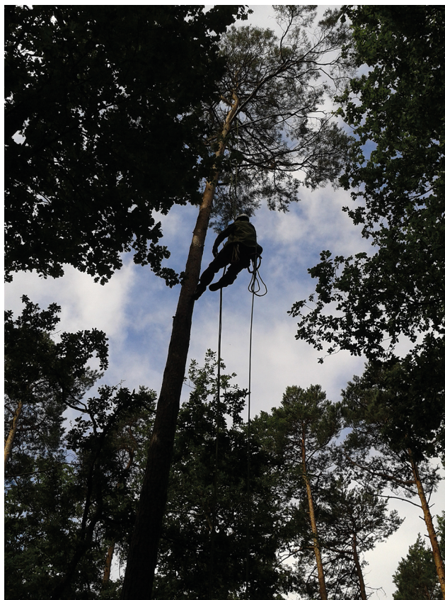
Nathalie Korboulevsky / INRAE

Dans OPTMix nous nous heurtons à un problème méthodologique majeur qui est de quantifier l'apport de la nappe d'eau temporaire, dont la hauteur fluctue en fonction des périodes. Le bilan en eau est alors difficile à établir avec certitude. Ce d'autant plus que la taille effective du réservoir dépend aussi de la profondeur de prospection des racines et de leur capacité à absorber l'eau, à plus ou moins grande profondeur. Dans l'immédiat, nous n'avons encore que partiellement exploré cette question. Une manière indirecte de faire est de confronter les don-