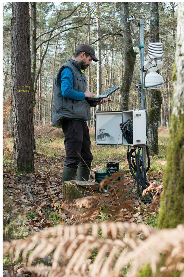
↑ Photo 1. Relevé d'une centrale d'acquisition des données des capteurs du microclimat dans les parcelles forestières du dispositif OPTMix

Comment les deux stratégies sylvicoles envisagées (densité, mélange) jouent-elles sur la vulnérabilité des arbres face aux contraintes hydriques ? Concernant l'effet du mélange d'espèces en conditions limitantes la littérature fait état de résultats encore très partiels et contradictoires car ils dépendent de l'identité des espèces en mélange et du contexte pédoclimatique (Bertness & Callaway, 1994 ; Grossiord et al. 2014 ; Grossiord et al. 2015). Au sein du dispositif OPTMix, nous suivons la croissance intra-annuelle sur plus de deux cents arbres depuis 2014. Grâce à cela nous avons pu montrer que le déficit hydrique du sol était le facteur principal qui expliquait la variabilité interannuelle de la croissance du chêne sessile et du pin sylvestre, avec une croissance radiale réduite de 40 %, voire nulle pour certains arbres, lorsque les précipitations ne sont plus suffisantes pour combler la demande des arbres (Toïgo et al. , 2015).