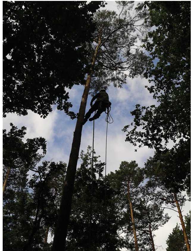
Nathalie Korboulewsky / INRAE

Dans OPTMix nous nous heurtons à un problème méthodologique majeur qui est de quantifier l'apport de la nappe d'eau temporaire, dont la hauteur fluctue en fonction des périodes. Le bilan en eau est alors difficile à établir avec certitude. Ce d'autant plus que la taille effective du réservoir dépend aussi de la profondeur de prospection des racines et de leur capacité à absorber l'eau, à plus ou moins grande profondeur. Dans l'immédiat, nous n'avons encore que partiellement exploré cette question. Une manière indirecte de faire est de confronter les don-