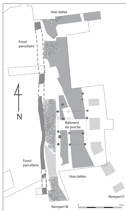
Fig. 1 : Gergovie, porte sud, phase 1 (70 – 50 av. n. è.)

Le bâtiment de porche a été installé au bout d'un couloir étroit formé par les deux murs. La construction en bois repose sur les deux murs latéraux, et également sur des poutres verticales posées en lignes de trois. La