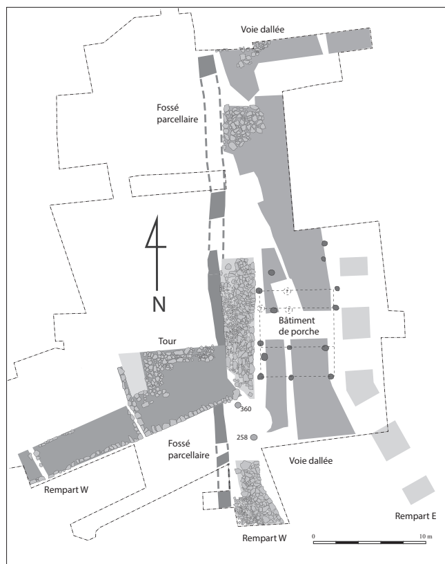
Fig. 2 : Gergovie, porte sud, phase 2 (vers 30 av. n. è.)

présence de quatre rangées de poteaux suggère qu'il s'agit d'une porte double. Le plan de ce bâtiment est très caractéristique des bâtiments de porche des oppida gaulois de l'Europe tempérée (Fichtl 2014).