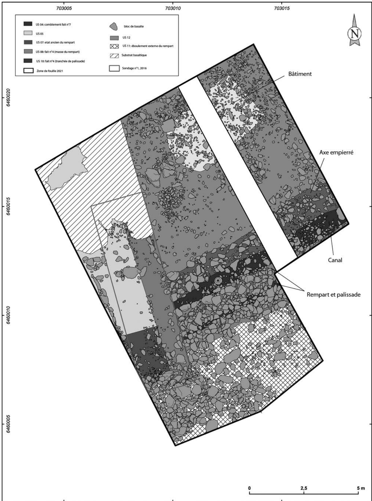
Fig. 2 : relevé en plan du sol de La Tène B2-C et des structures archéologiques associées.

rempart, et probablement de ses structures associées (canal et voie empierrée) marque la genèse de cette occupation, probablement au cours de La Tène B.