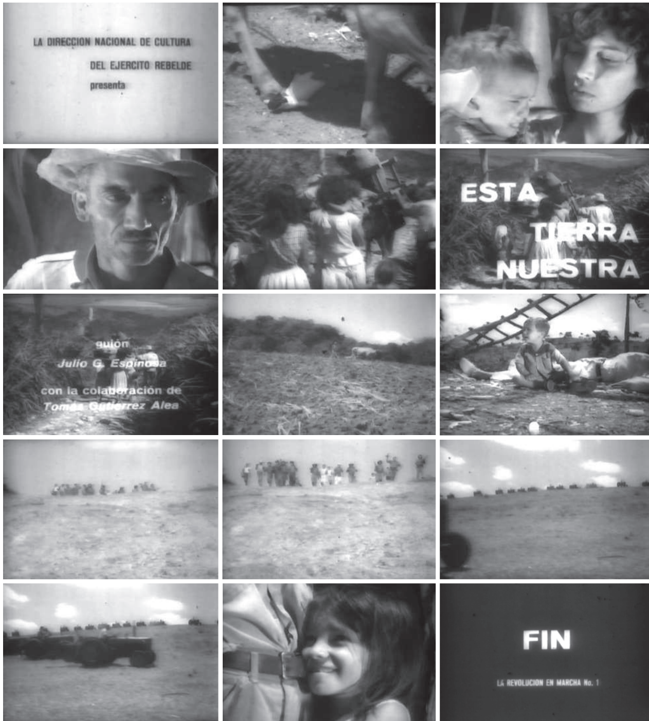
Esta tierra nuestra (T. Gutiérrez Alea, 1959)