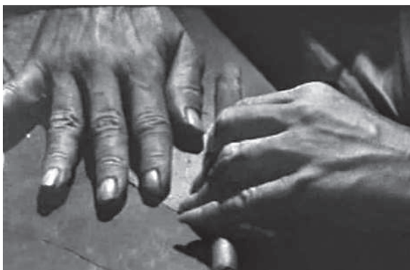
El arte del tabaco (T. Gutiérrez Alea y otros, 1974)