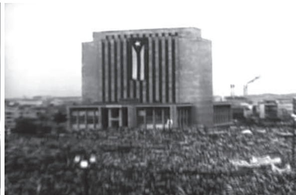
Muerte al invasor (T. Gutiérrez Alea, 1961)