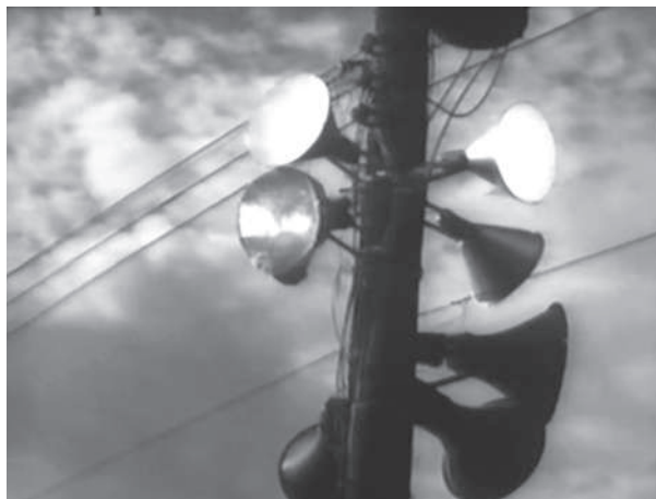
Asamblea general (T. Gutiérrez Alea, 1960)