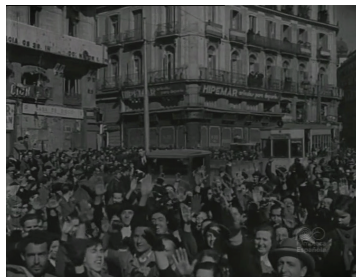
Fig. 13. La liberación de Madrid

Le deuxième film qui est représentatif de cet « effet de plein », est l'édition du Noticiario (actualité cinématographique) qui rend compte du défilé militaire du 19 mai 1939 et qui représente, selon Vicente Sánchez-Biosca, le « Punto culminante de ese ambicioso proyecto propagandístico en el que la ocupación se presentaba como la ansiada unión de todos los españoles