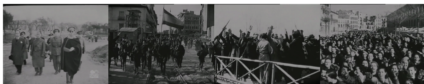
Fig. 8-11. La liberación de Madrid , © DR

Dans le troisième temps du film, qui correspond aux six dernières minutes, parallèlement à la mise en scène du « marquage présence », le « marquage trace » correspondant à la nouvelle identité urbaine reconquise s'impose, sous le signe du plein, avec la reprise d'une iconographie qui renvoie à celle de la période antérieure (marquer provisoirement l'espace pour se l'approprier symboliquement) tout en procédant en même temps à son effacement. Le « marquage trace » commence avec un plan très appuyé de la statue de Don Quichotte, sur la Place d'Espagne, où des drapeaux ont été spontanément fichés. Il se poursuit ensuite de manière systématique par la mise en scène des principaux édifices de la ville sur lesquels ont été disposés en bonne place ces mêmes drapeaux, avant de culminer de manière beaucoup plus massive avec l'occupation des façades. À la diversité des types de « marquages traces » de la période de la guerre dans le camp républicain se substitue la monotonie répétitive des drapeaux et des portraits au nom de José Antonio ou de Franco. Le peuple de Madrid n'a de sens que par rapport à des guides qui l'orientent.