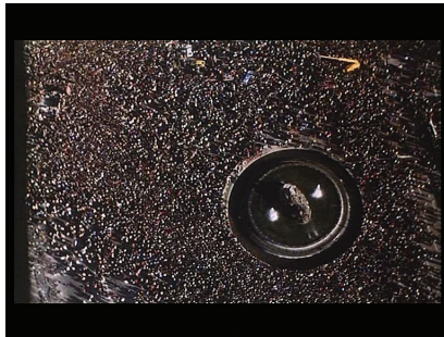
Fig. 20-21- Madrid

de celui que les Madrilènes appelaient affectueusement le « viejo profesor » ont été l'occasion d'une concentration aux proportions tout à fait inédites dans la ville pour ce genre d'événement, avec plus d'un million de personnes qui lui ont rendu un vibrant hommage. Les images qui ont été filmées à l'occasion et qui depuis n'ont cessé de circuler, ont fonctionné comme des images réparatrices pour les Madrilènes à la mémoire « invisibilisée » durant les quarante années de dictature. Au cœur du film Madrid , de Basilio Martín Patino, réalisé en 1987, la séquence qui met en scène ces funérailles dans le cadre d'une récupération plus générale de la mémoire urbaine du peuple de Madrid accorde une importance toute particulière au « marquage présence » de l'espace emprunté par le cortège, depuis la place de la Villa jusqu'à la place de Cibeles, reconquise par le peuple, dont rend compte un impressionnant plan général en plongée verticale, dans lequel la foule fait littéralement corps avec la ville, réalisant une sorte d'équation fusionnelle entre Tierno Galván, la foule de Madrilènes et cet espace urbain pleinement reconquis.