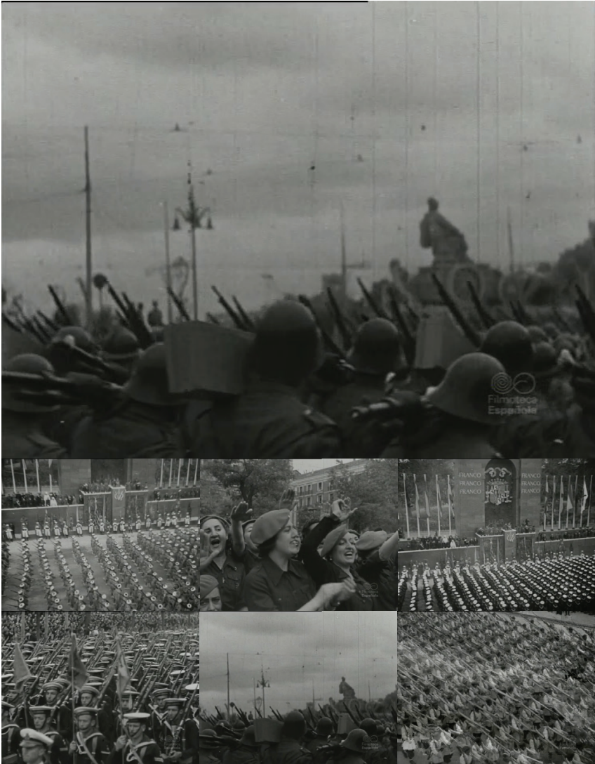
Fig. 14-19 El Desfile de la Victoria

Au-delà du moment circonstanciel de récupération de l'espace urbain madrilène dans l'urgence de la victoire, avivée par la frustration d'en avoir été privé pendant trois ans, le régime de Franco a pu inscrire la nouvelle identité de la ville et partant, du pays, au sein de la capitale pendant quasiment quatre décennies, notamment donc en l'inscrivant dans la pierre à travers l'édification de monuments, d'édifices, et de quartiers, liée à la nécessité de reconstruction à certains endroits et à d'autres, au besoin urgent de dévelop-