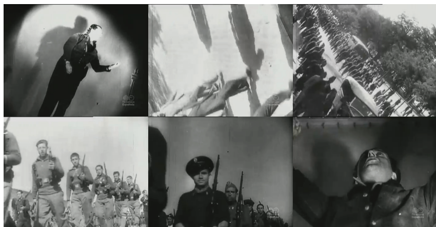
Fig. 2-7. Defensa de Madrid