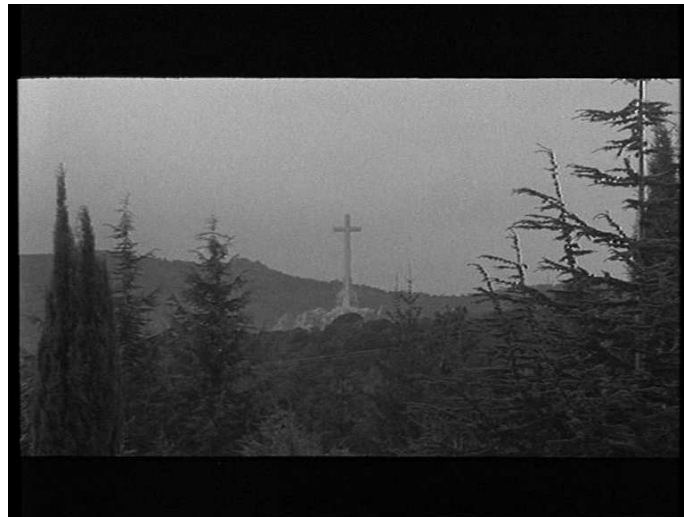
Rafael Gil, ... Y al tercer año resucitó (1980).

La fiction raconte la résurrection de Francisco Franco, qui, de retour à Madrid incognito , doit faire face au processus de démocratisation connu par le pays depuis trois ans. Descendu du Valle de los Caídos, dont l'image ouvre le film par un plan général en contre-plongée rappelant fortement la rhétorique de la verticalité, il y retournera pour toujours à la fin de l'histoire, qui se termine sur une vision de la basilique vers laquelle il se dirige, comme on rentre chez soi après un éprouvant voyage.