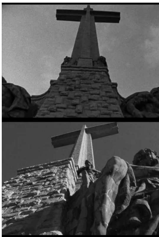
Pere Portabella, Informe general sobre algunas cuestiones de interés para una proyección pública (1977).