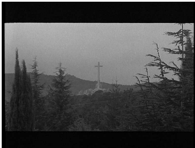
Rafael Gil, ... Y al tercer año resucitó (1980). © DR

La fiction raconte la résurrection de Francisco Franco, qui, de retour à Madrid incognito , doit faire face au processus de démocratisation connu par le pays depuis trois ans. Descendu du Valle de los Caídos, dont l'image ouvre le film par un plan général en contre-plongée rappelant fortement la rhétorique de la verticalité, il y retournera pour toujours à la fin de l'histoire, qui se termine sur une vision de la basilique vers laquelle il se dirige, comme on rentre chez soi après un éprouvant voyage.