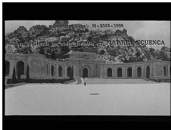
Rafael Gil, ... Y al tercer año resucitó (1980).

qu'on aborde le sujet je me dispute beaucoup avec mon père. Parce qu'il s'accroche au passé. Et cela, ce n'est pas non plus possible. Franco, c'est déjà de l'histoire. Très respectable, sans nul doute, mais de l'histoire, au bout du compte» 34 . La verticalité du Valle de los Caídos, filmée aux deux extrémités du film, est assumée comme un héritage, certes intangible, mais aussi et surtout comme un lieu de mémoire du passé. Si la verticalité a pu être contrariée pendant le temps de la fiction, avec la descente de Franco parmi les mortels, elle redevient, avec le dernier plan du film en forte contre-plongée qui renvoie au premier, un élément du paysage inscrit dans le passé. C'est ce discours-ci, et non pas celui de Sáenz de Heredia, nostalgique, qui s'impose à un moment de la Transition où les héritiers de Franco se rendent compte que le « continuismo » 35 ne présente aucun intérêt pour eux et qu'il faut laisser le passé à sa place. C'est ce que symbolise le dernier plan du film de Rafael Gil, représentant un Valle de los Caídos désert et recouvert de neige où s'achemine Franco dans une solitude signifiée par la taille de sa silhouette minuscule perdue dans l'immensité du plan général, tandis qu'il progresse vers l'entrée de la basilique, sur une esplanade dont le vide est souligné par la blancheur immaculée de la neige.