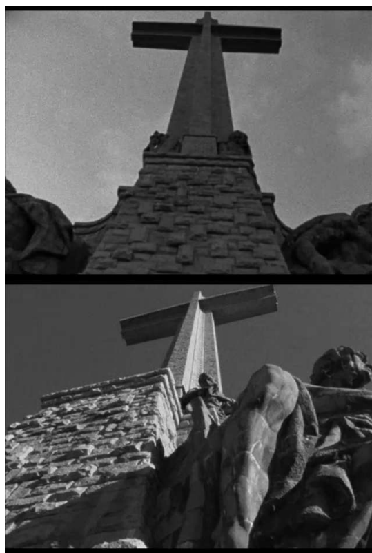
Pere Portabella, Informe general sobre algunas cuestiones de interés para una proyección pública (1977).