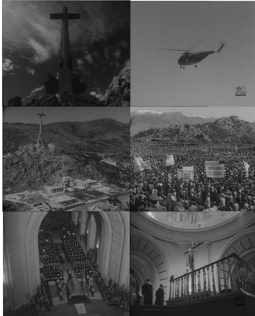
Photogrammes extraits du NO-DO.

le Caudillo, la verticalité fut associée à deux principes conjoints liés au catholicisme : l'élévation et la transcendance. C'est tout l'ensemble qui prenait ainsi sens et fut exalté pendant son édification, qui ne devait durer qu'une douzaine de mois, mais qui se prolongea jusqu'à son inauguration, en grande pompe, le 1 er avril 1959 10 .