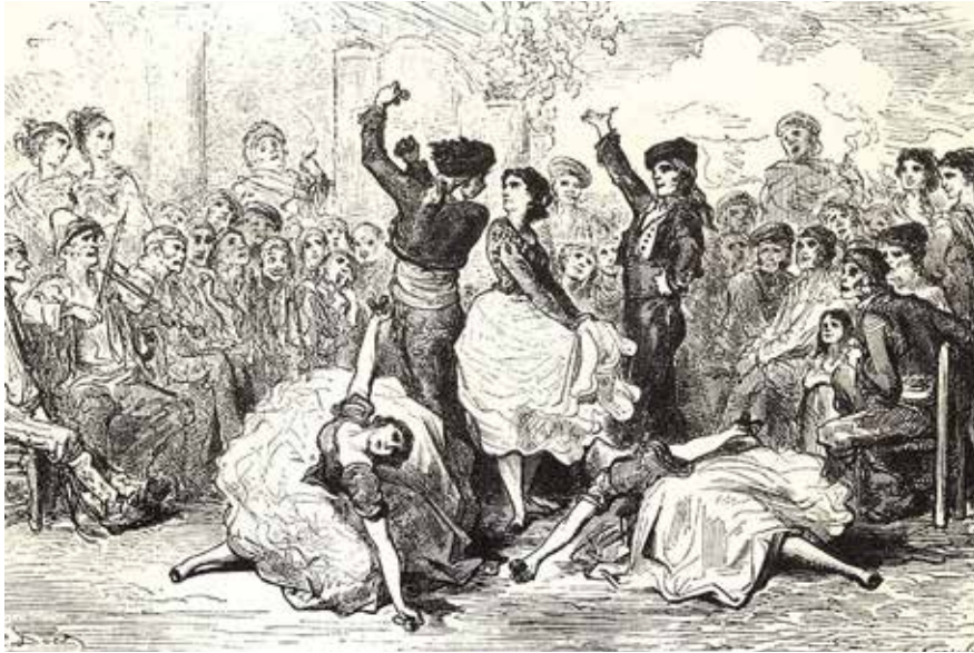
Un baile de cañil en el barrio de Triana (1874), de Gustave Doré.

Grabado incluido en el volumen Viaje por España de Charles Davillier (siglo XIX).