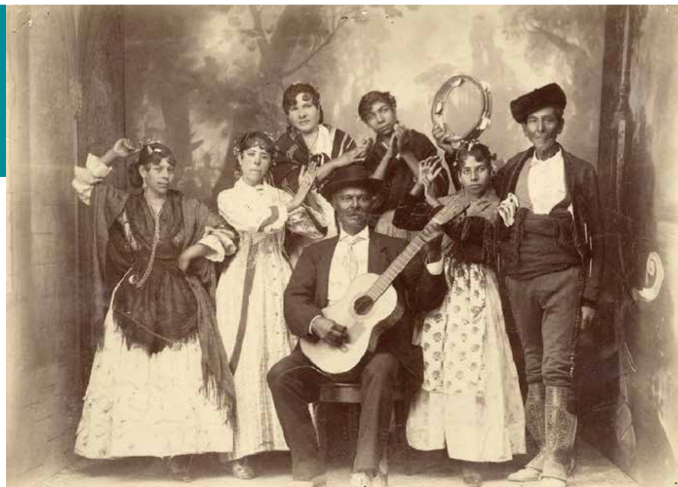
Museo Casa de los Tiros de Granada.