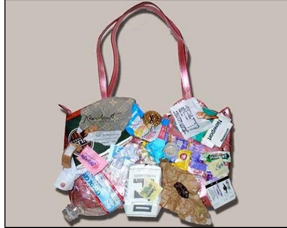
Visuel 1 : Produit en matériaux recyclés sans impact visuel de l'attribut durable

Louis Vuitton a lancé le sac Urban Satchel, conçu à partir d'objets recyclés : paquets de cigarettes, emballages de chewing-gum, étiquettes, vieux billets et bouteilles d'eau fabriqués en patchwork. Ce sac est vendu au tarif de 125 000 euros.