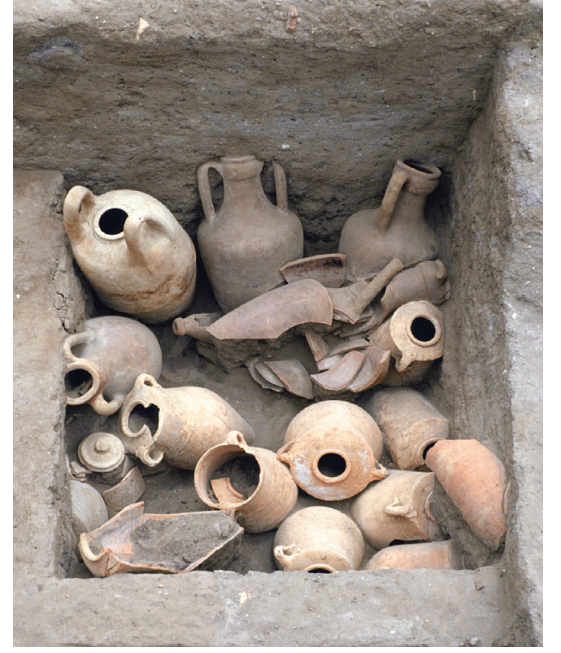
٥. مجموعة أمفورات من منتصف القرن الخامس ق.م. © البعثة المصرية الفرنسية بتل الحير.

كاترين ديفرنيز (المركز الوطني للبحث العلمي، UMR 8167)