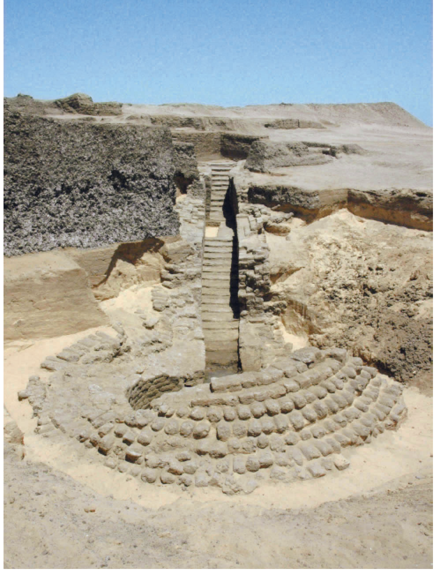
٣. بناء منقور في حجر من النصف الأول من القرن الخامس ق.م.، في الزاوية الشمالية الشرقية للتل.