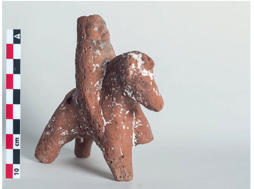
٤. تمثال من التراكوتا لفارس فارسي.