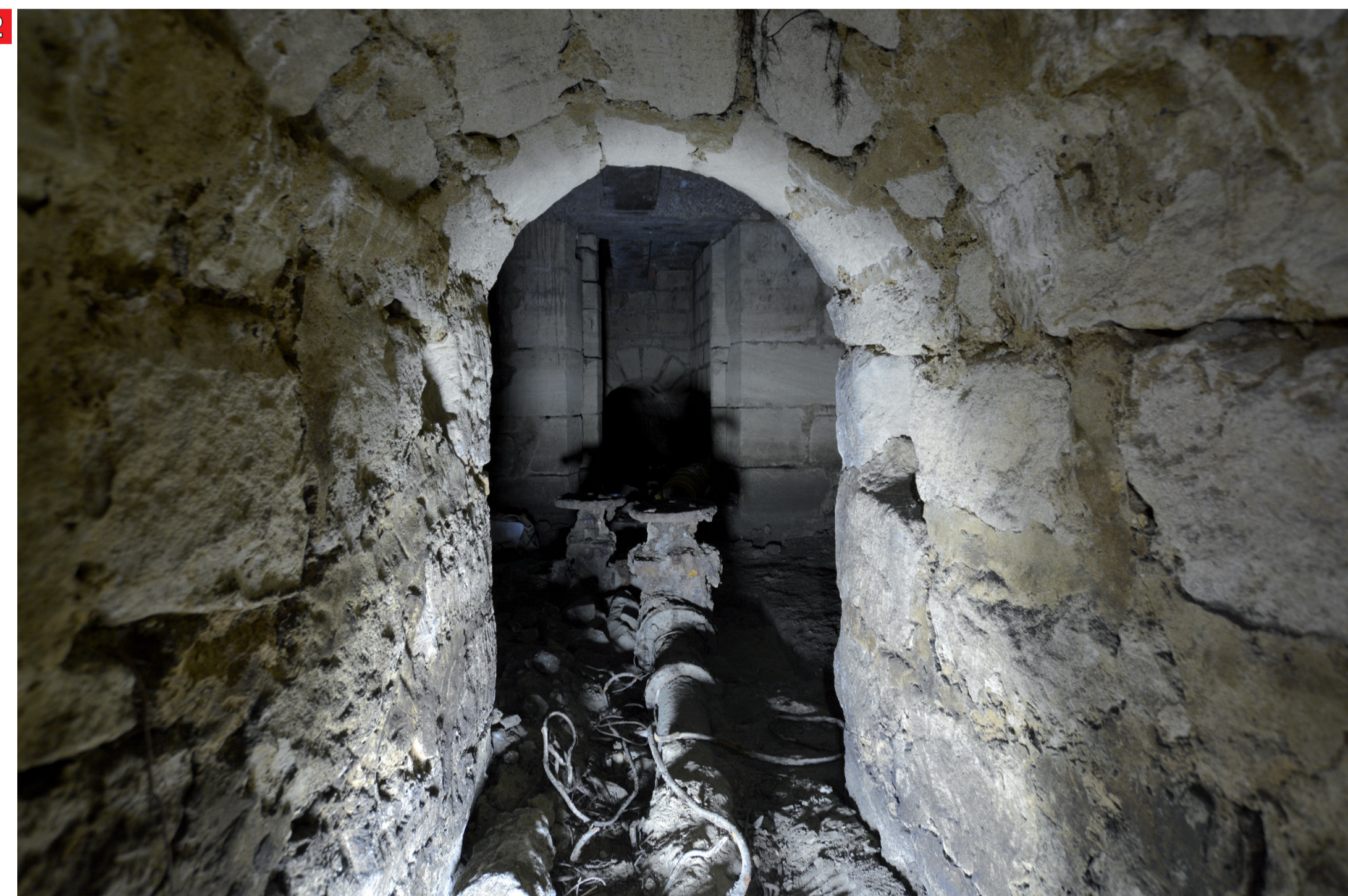
2 Le regard qui permettait l'accès aux conduites pour la maintenance a été arasé en surface pour le nivellement de la chaussée. Les deux canalisations sur lesquelles sont installées des vannes d'arrêt reposent dans un bassin rectangulaire.