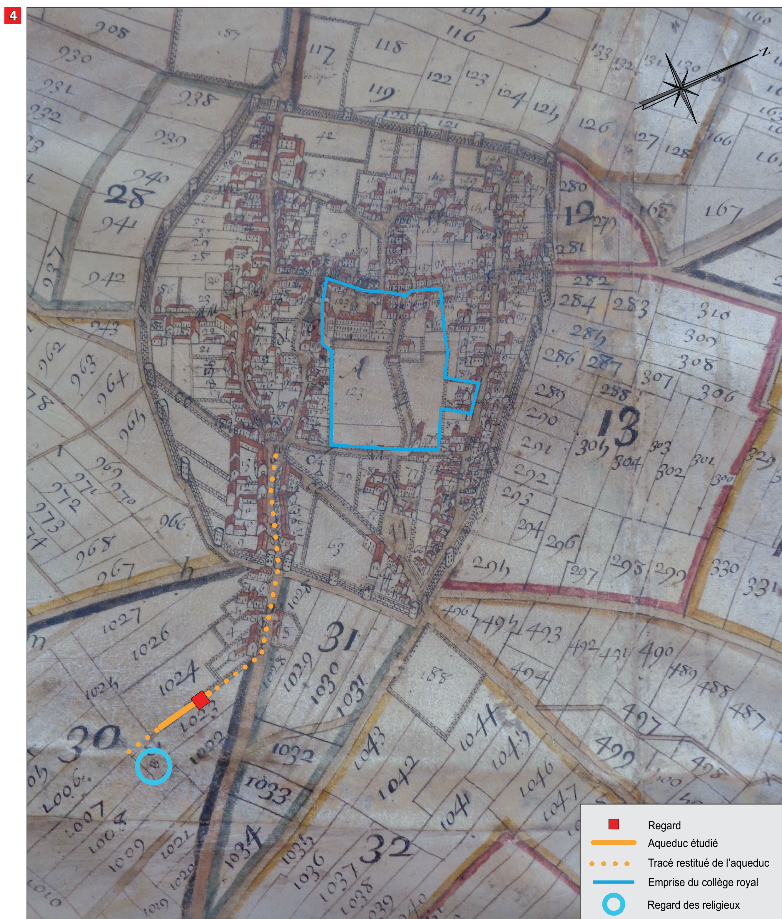
4 On resitue une partie du parcours de l'aqueduc depuis l'extérieur vers l'intérieur du bourg en direction du collège royal sur le plan le plus ancien de Nanterre (1688). Cet établissement, par ses possessions foncières, occupe une position centrale dans le modeste village de Nanterre ceint par un mur. © Plan de la terre et seigneur de Nanterre appartenant à l'abbaye de Sainte-Geneviève du Mont de Paris, Société d'Histoire de Nanterre