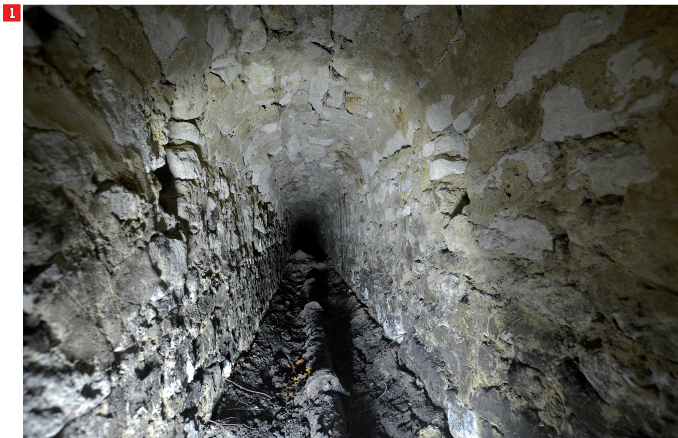
1 On observe sur chaque mur de la galerie la présence de mortaises ayant accueilli les tenons du cintre employé pour la conception de la voûte. Le sol est pavé de blocs qui forme la cunette sur laquelle repose une conduite.