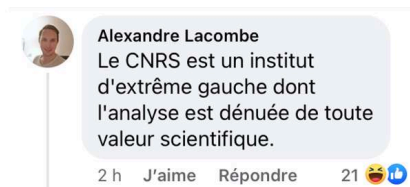
Figure 3 : Premier message troll