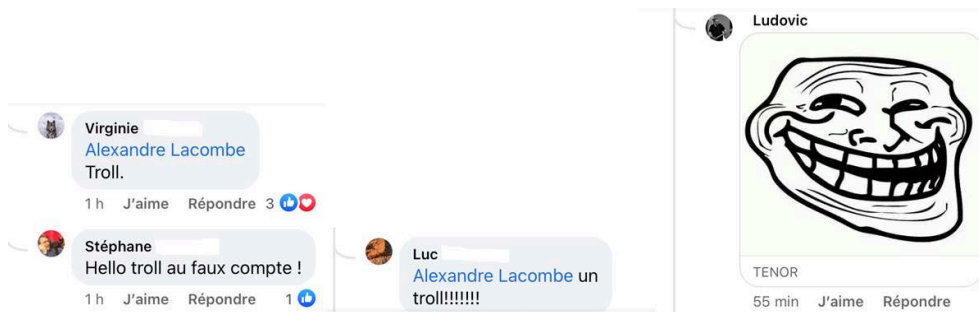
Figure 4 : Identification et désignation de l'émetteur du message polémique comme troll