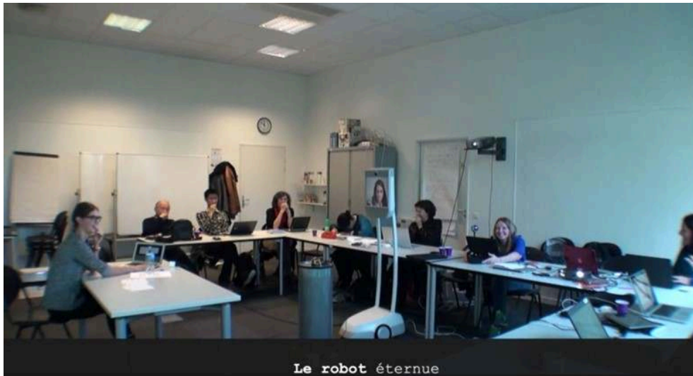
Figure 1 : La participante au sein du robot éternue ce qui provoque un fou rire collectif au sein de l'assemblée en présence physique et le commentaire oral « Le robot éternue »

41 Enfin, au terme de cette étude, huit nouvelles « règles » de politesse à la manière des maximes de Grice (1979) et Sperber et Wilson (1989), mais propres à un tel contexte sont proposées (ibid. : &chapitre4.html#analyses-et-resultats) :