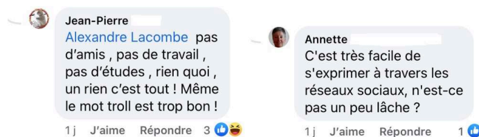
Figure 8 : Pseudonymat et effet cockpit