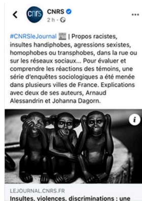
Figure 2 : Post initial du CNRS