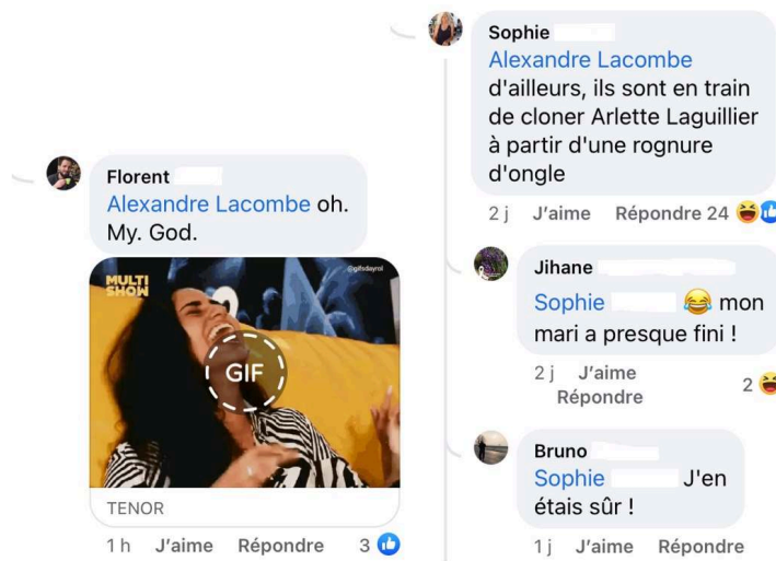
Figure 6 : Le troll suscite rire et ses propos sont tournés en dérision