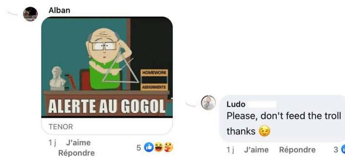
Figure 7 : Avertissement à destination des autres internautes