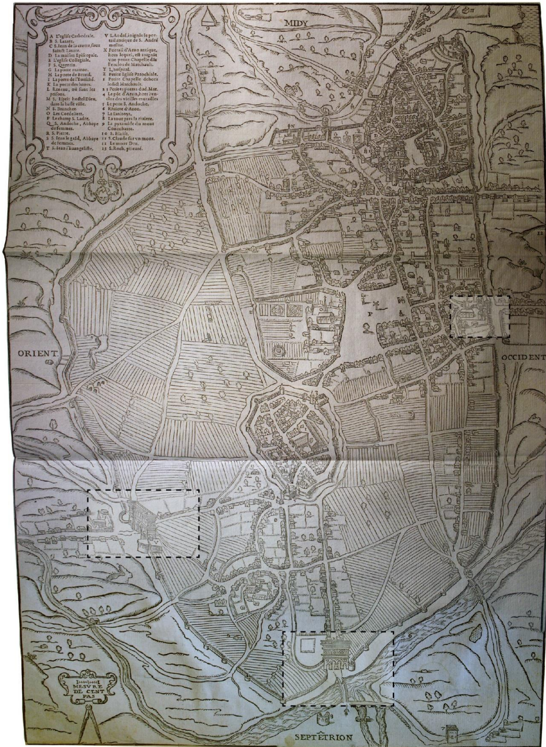
Fig. 1 – Vue de la ville d'Autun dans la 2 de moitié du XVI e siècle (« Plant et Pourtrait de la ville d'Authun » dans François de BELLEFOREST, Sebastian MÜNSTER, La Cosmographie universelle de tout le monde , Paris, M. Sonnius / N. Chesneau, 1575).

CY Cergy Paris Université, UMR 9022 HÉRITAGES (CYU – CNRS – Ministère de la Culture)