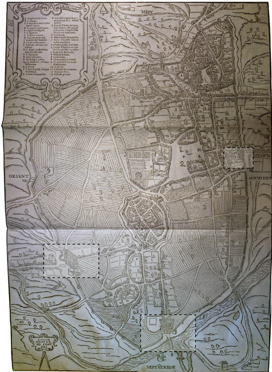
Fig. 1 – Vue de la ville d'Autun dans la 2 de moitié du XVI e siècle (« Plant et Pourtrait de la ville d'Authun » dans François de BELLEFOREST, Sebastian MÜNSTER, La Cosmographie universelle de tout le monde , Paris, M. Sonnius / N. Chesneau, 1575).

CY Cergy Paris Université, UMR 9022 HÉRITAGES (CYU – CNRS – Ministère de la Culture)