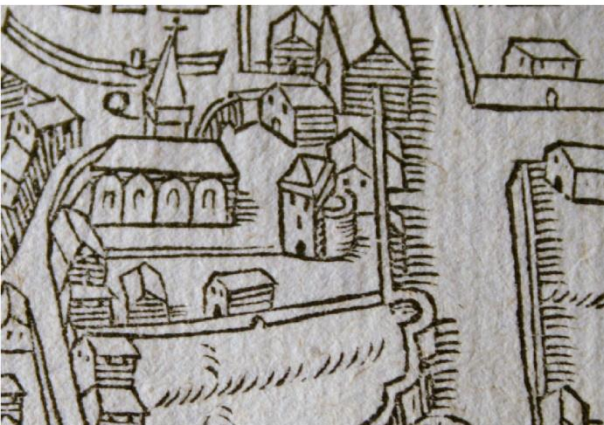
Tour romaine du monastère de Saint-Andoche