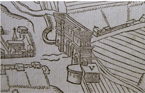
Eglise Saint-André dans la tour de flanquement de la porte romaine du même nom