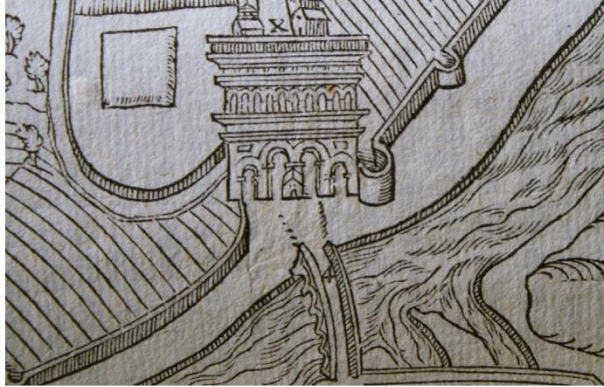
Chapelle de Notre-Dame d'Arroux contre le piédroit de la porte romaine du même nom

selon le poète-antiquaire, la Vierge Marie a remplacé Minerve à la porte d'Arroux, l'ancien temple consacré à Hercule est désormais occupé par saint André au niveau de la porte du même nom et les dieux ancestraux des Éduens qui avaient leur temple à l'emplacement du monastère de Saint-Andoche ont laissé la place aux trois apôtres évangélistes de la ville (Fig. 2). Là où la protection des dieux païens n'a pas su éviter les désastres, celle des saints éloigne efficacement ennemis et incendies – tel est le propos général de ses trois poèmes.