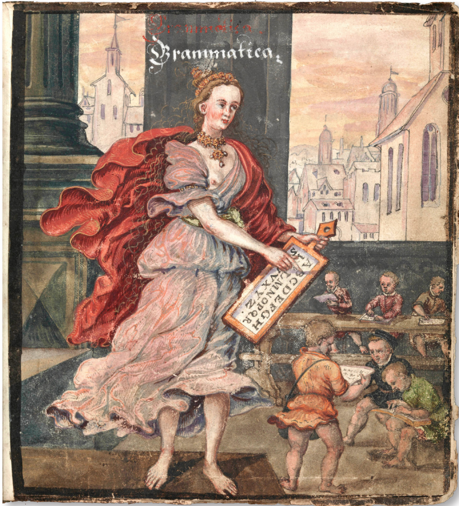
Fig. 2. Grammaire , gouache, avant 1605, Album amicorum de Hans Ludwig Pfinzing von Henfenfeld. Bibliothèque de Bamberg: Msc.Hist.176, fol. 70v-71r.

Cet album, dont les dates extrêmes sont 1580-1625, fut composé tout le long de la vie d'Hans Ludwig Pfinzing. L'image de la Grammaire qui s'apparente à la peinture de genre en raison du caractère anecdotique de la scène, est la première d'une série d'images consacrées aux Arts Libéraux: Grammaire, Dialectique, Rhétorique, Musique, Arithmétique, Géométrie et l'Astronomie. La figure ne suit pas l'iconographie traditionnelle décrite par Cesare Ripa [Ripa, 1603], 5 évoquant plutôt des modèles flamands, comme les estampes du même sujet,