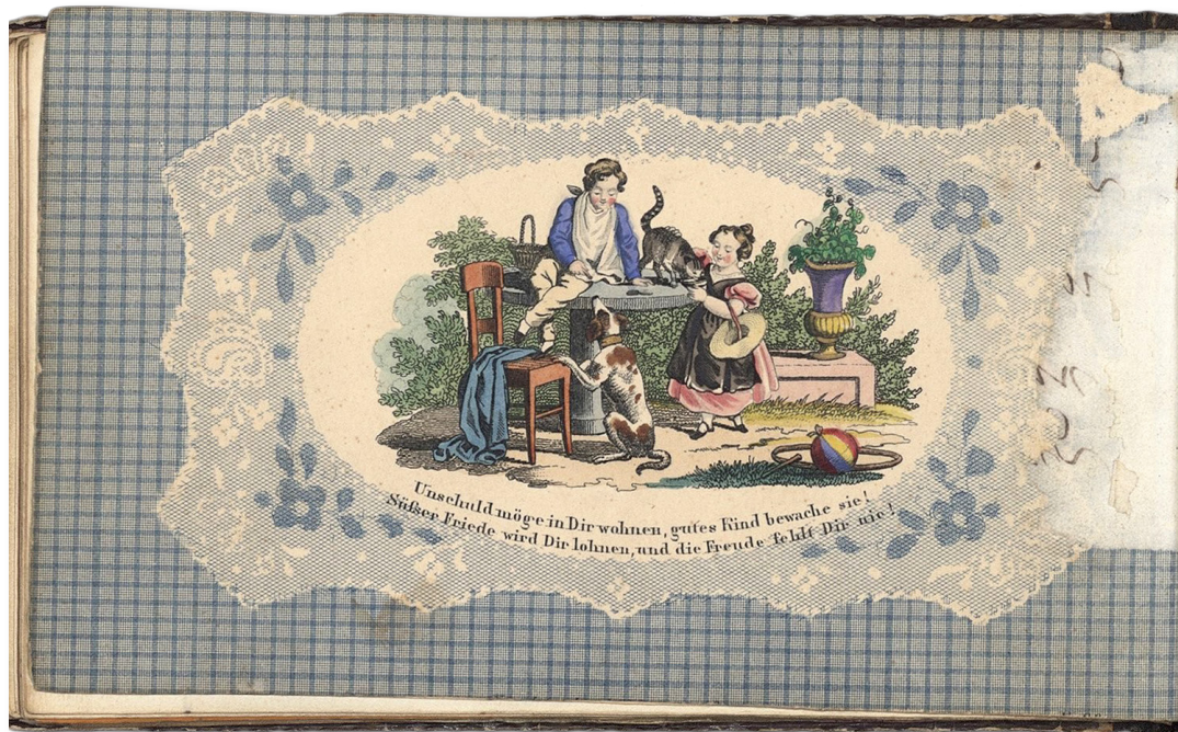
Fig. 5. Dédicace dans l' Album amicorum de Louise Klein . Estampe, papier gaufré. Strasbourg, Société des Amis des Arts et des Musées de Strasbourg: SAAMS LA 109.

L'innocence et la joie sont la force de cet être délicat que la société se doit de protéger et préserver: « Unschuld möge in dir wohnen, gutes Kind bewache sie! Süsßer Friede wird Dir lohnen, und die Freude felili Dir nie! » [Que l'innocence demeure en toi, garde-la, bon enfant/ Et une douce paix demeurera en toi, la joie ne te quittera jamais !] (Klein, 1845-1847) [fig. 5]. À une table placée dans un jardin, un garçon joue avec un chien tandis qu'un chat est nourri par une jeune fille. Ils ont abandonné par terre leurs jouets d'enfants, un cercle et une balle, pour mimer les adultes dans un pique-nique imaginaire. Images en miniature du père éducateur et de la mère nourricière, la scène illustre les rôles parentaux dans le modèle de la famille moderne préconisé dans l' Émile (Rousseau, 1762: 51-52). Le déjeuner du chat, topos de la peinture du milieu du XIX e siècle, à propos duquel on rappellera les toiles de Marguerite Gérard (1761-1837), évoque aussi la pratique, notamment dans la société bourgeoise, d'offrir un chat aux jeunes filles pour les préparer à la vie de mère au foyer, dévouée à sa progéniture.