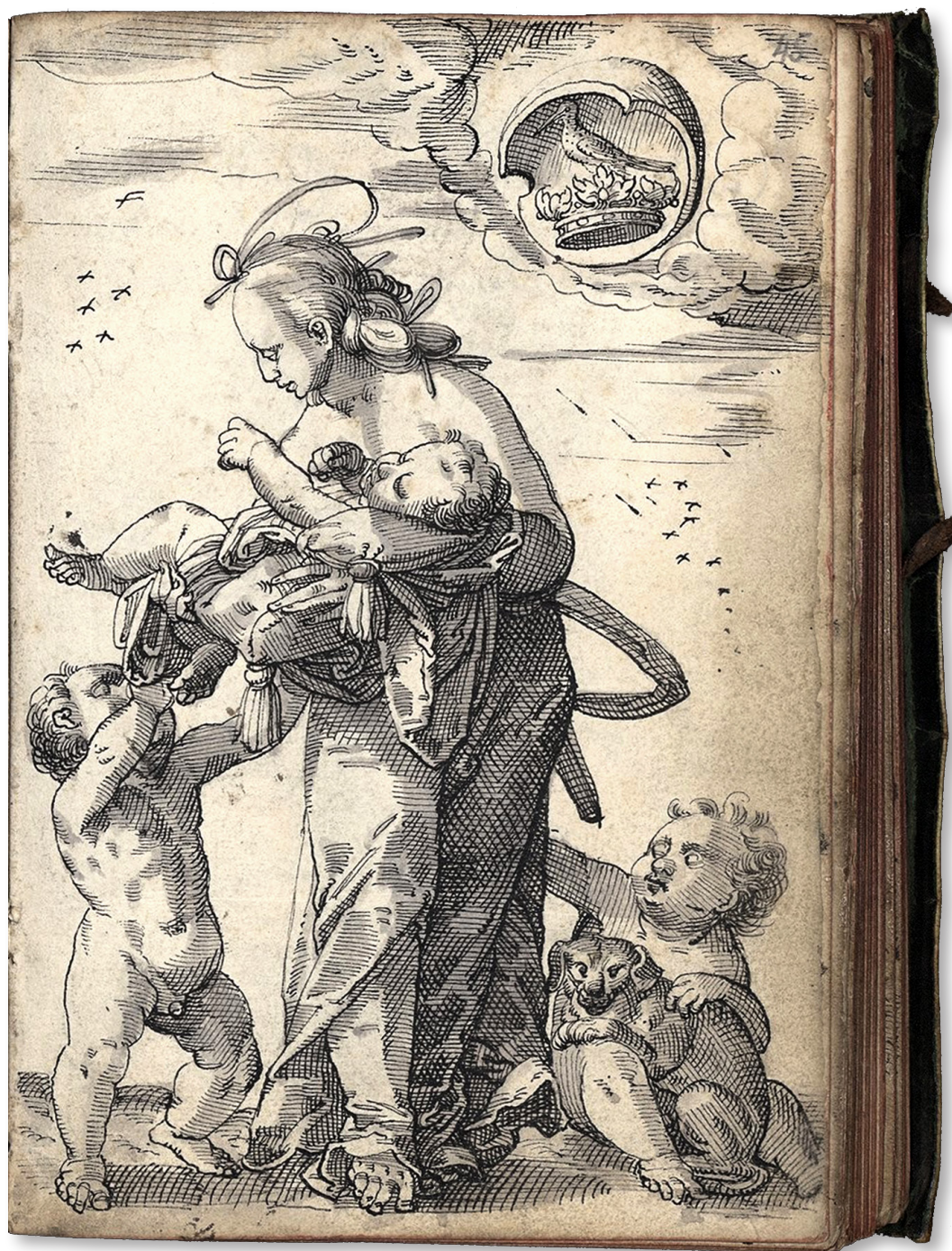
Fig. 1. Christoph Maurer, Charitas , dessin à la plume, 1588, Album contenant quinze dessins à la plume dédié à Dietrich Meyer . Bibliothèque nationale et universitaire de Strasbourg: ms.2.522, fol. 45r.