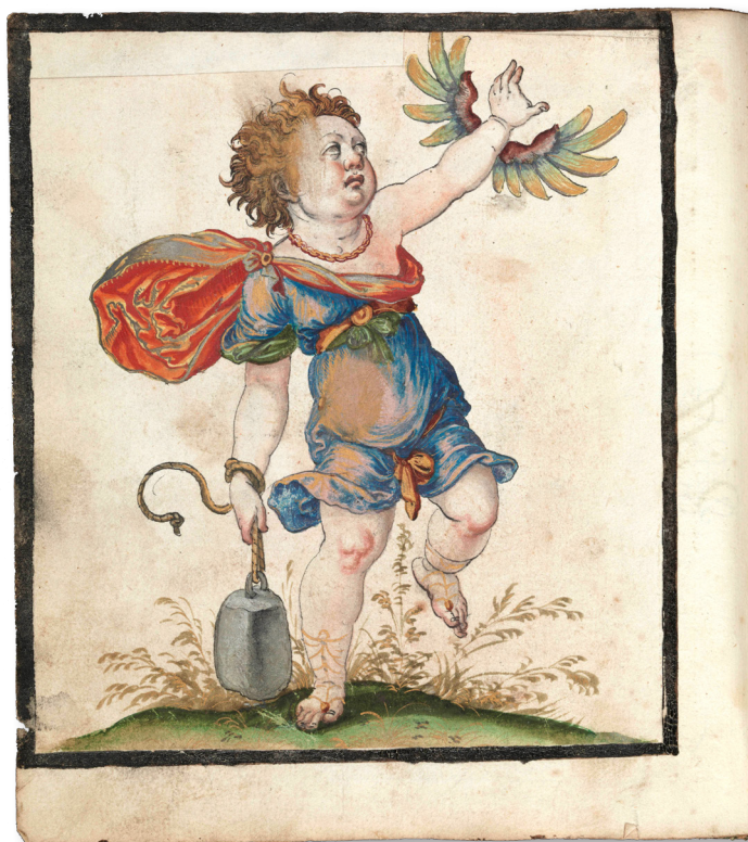
Fig. 3. Copie de l'emblème «Paupertatem summis ingeniis obesse ne provehantur» d'André Alciat, Album amicorum de Hans Ludwig Pfinzing von Henfenfeld . Bibliothèque de Bamberg: Msc.Hist.176, fol. 36v.

A côté d'enfants en fonction d'attribut et de personnages de l'univers mythologique, parfois des figures puisées dans les livres d'emblèmes (Alciat, 1534; Pfinzing von Henfenfeld, 1580-1625: 36v) [fig. 3], 7 le monde des plus petits est illustré dans les alba amicorum par le moment de récréation et de jeu.