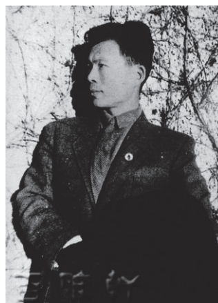
Fig. 2a : Wu Guanzhong, jour de remise de diplôme, École nationale des Beaux-arts, Chongqing, 1942.

Presque rien ne reste de la production artistique des années de guerre du cercle des étudiants de Hangzhou. Les jeunes artistes ne cessèrent jamais de dessiner malgré les difficultés du chemin. Ils fabriquèrent les couleurs localement, en bricolant eux-mêmes de la peinture à l'huile, de l'aquarelle et les châssis. Mais les conditions difficiles et la violence des événements politiques en Chine eurent raison de leur production de jeunesse. Zhu Dequn perdit tout ses dessins du Hunan, de Kunming et de Chongqing au cours de la tumultueuse descente en bateau du Yangzi qui, à la fin de la Seconde guerre sino-japonaise, le ramena du Sichuan au Jiangsu 41 .