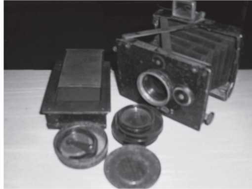
Fig. 6 : Appareil photographique de Xia Ming utilisé dans les années 1940 à Lijiang et à Muli. Collection privée.

de dormir dans les alentours des monastères), que les enfants étaient libres de jouer et crier à côté du monastère, qu'ils n'étaient pas obligés d'enlever leurs bérets à l'intérieur des monastères, ou encore le fait que Xia Ming avait adopté un cheval plus grand que le cheval du roi et qu'il avait organisé un mariage de style chinois à l'intérieur du monastère, tous ces faits avaient profondément déplu à la population locale et offensé la communauté monastique et le roi. Les relations avec les autorités locales se firent de plus en plus tendues et distantes. Xia Ming fut menacé à plusieurs reprises et, craignant pour sa vie, il s'enfuit à Dali en juillet 1948. Par ailleurs, les autorités chinoises désapprouvaient le programme pédagogique mis en œuvre par Xia Ming. Il était considéré comme trop avant-gardiste, ouvert et relâché, il n'enseignait pas la propagande du gouvernement pour les régions frontalières et, par conséquent, il ne servait pas la « mission civilisatrice » promue par l'État aux frontières. Surtout, il n'avait pas réussi à scolariser les enfants du clan royal et des élites de Muli qui, dans l'esprit de la politique pédagogique gouvernementale de l'époque, étaient considérées comme les cibles prioritaires des programmes de sinisation. Après un énième refus d'intégrer le Guomindang, Xia Ming fut ouvertement suspecté d'être communiste. Sa vie était en jeu, il était recherché par la police d'État, et sa fuite ne pouvait plus attendre.