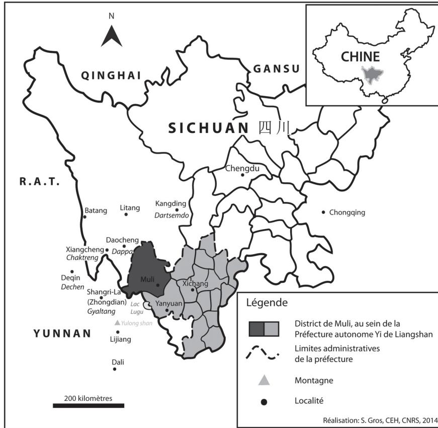
Fig. 4 : District tibétain autonome de Muli, préfecture Yi de Liangshan, province du Sichuan, RPC.