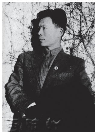
Fig. 2a : Wu Guanzhong, jour de remise de diplôme, École nationale des Beaux-arts, Chongqing, 1942.

Presque rien ne reste de la production artistique des années de guerre du cercle des étudiants de Hangzhou. Les jeunes artistes ne cessèrent jamais de dessiner malgré les difficultés du chemin. Ils fabriquèrent les couleurs localement, en bricolant eux-mêmes de la peinture à l'huile, de l'aquarelle et les châssis. Mais les conditions difficiles et la violence des événements politiques en Chine eurent raison de leur production de jeunesse. Zhu Dequn perdit tout ses dessins du Hunan, de Kunming et de Chongqing au cours de la tumultueuse descente en bateau du Yangzi qui, à la fin de la Seconde guerre sino-japonaise, le ramena du Sichuan au Jiangsu 41 .