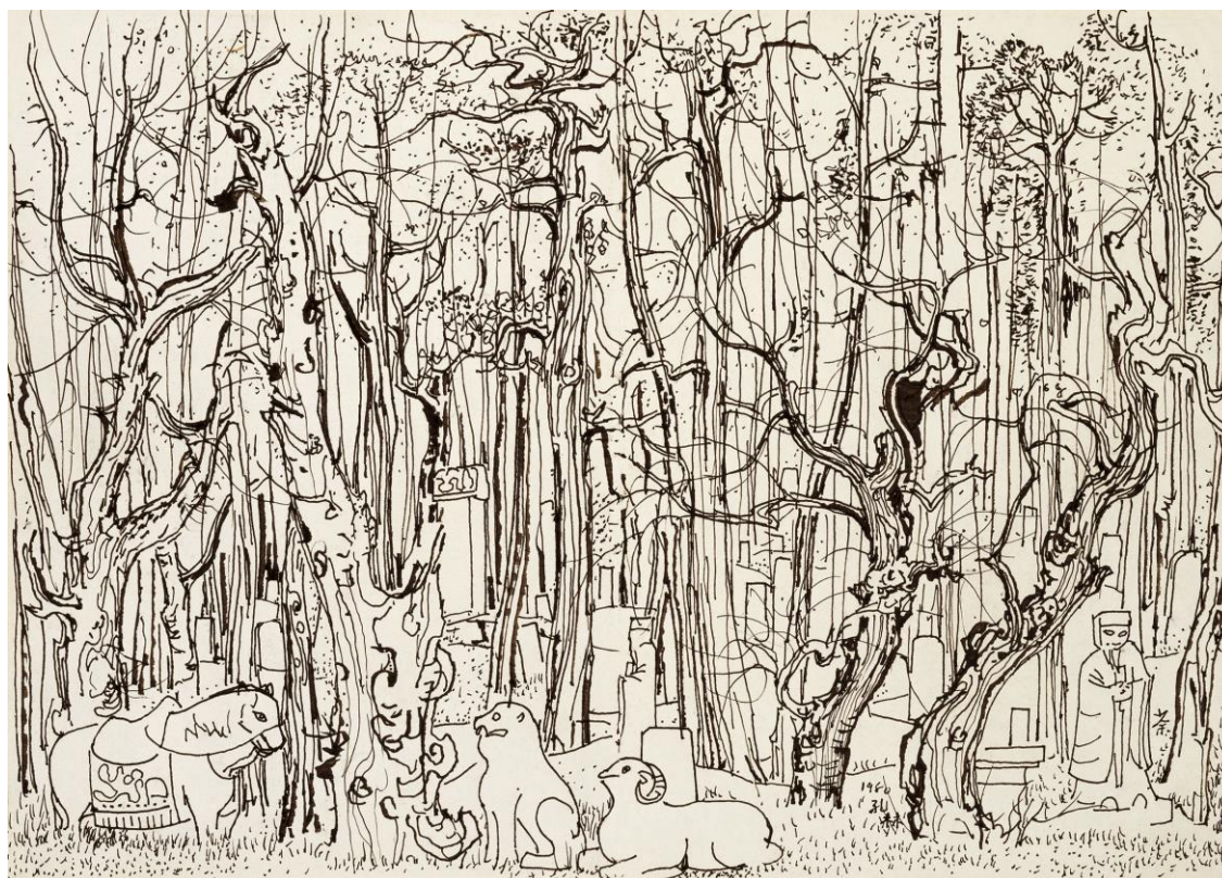
3. Wu Guanzhong, La Forêt de Confucius , 1980, collection de l'artiste.

Par exemple, Wu Guanzhong expliquait que, pour la plupart de ses paysages, comme La Forêt de Confucius ( Konglin ), tracée au stylo et au marker sur papier en 1980 (ill. 3), il commençait par un dessin sur le vif, par l'observation attentive 25 .