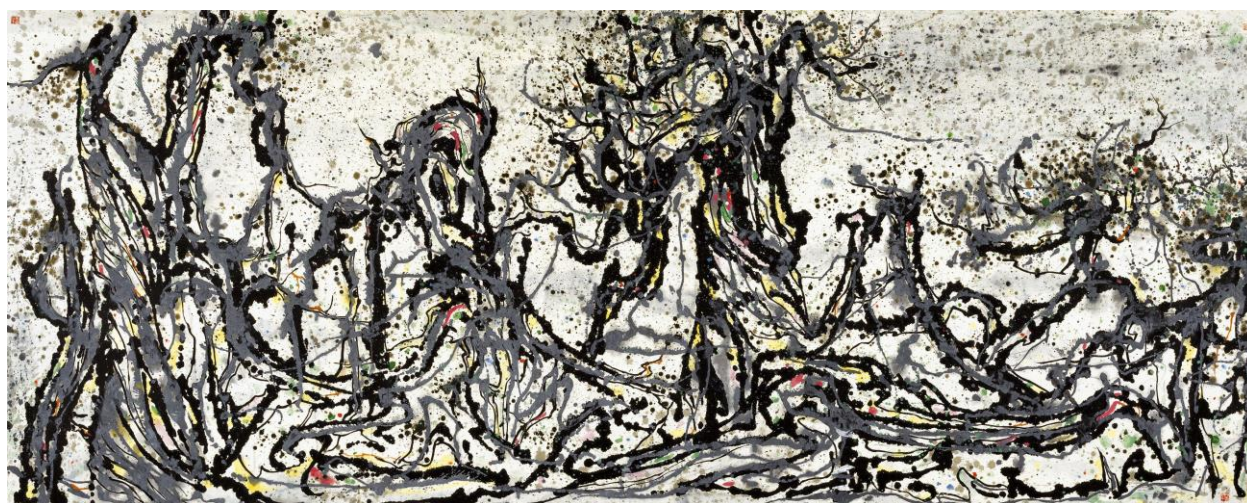
4. Wu Guanzhong, Cyprès chinois , 1983, musée des Beaux-Arts de Shanghai.

En 1983, Wu Guanzhong développe à la suite une série de peintures d'arbres de grand format, à l'encre et aux pigments naturels sur papier de Xuan, dont ses fameux Cyprès chinois ( Hanbo , 148 x 365 cm) (ill. 4).