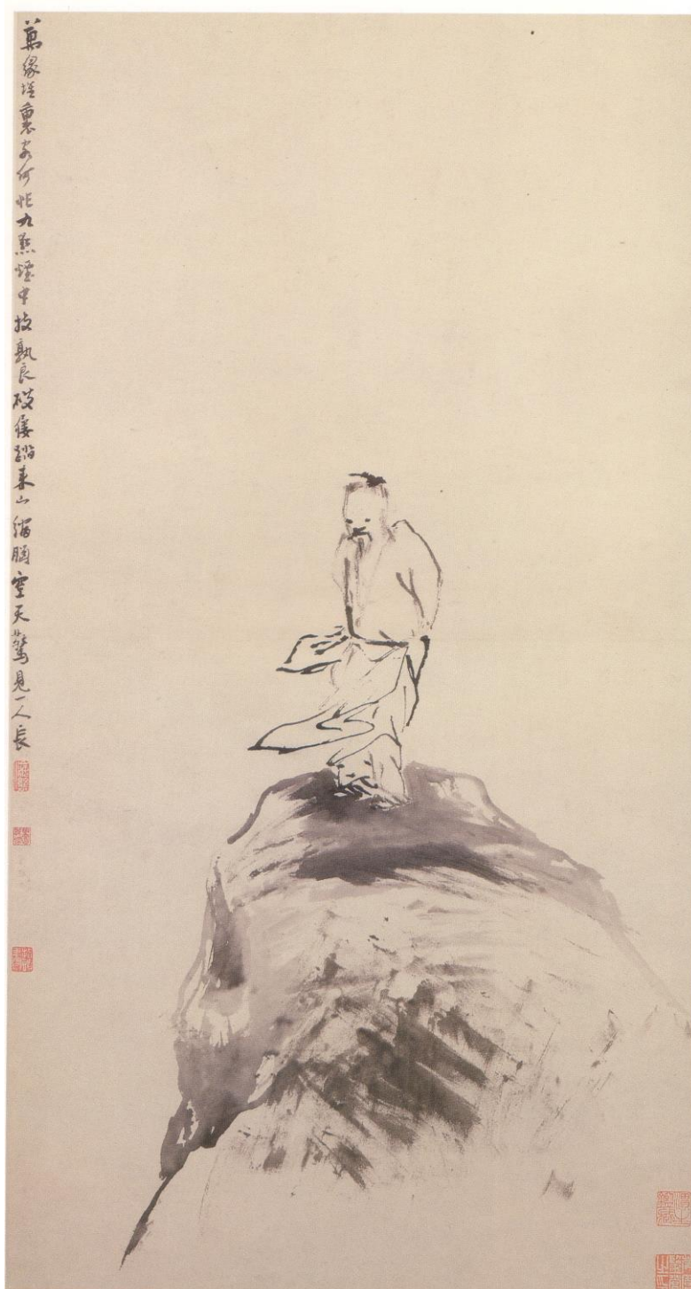
1. Gao Qipei, Debout seul sur un sommet élevé ( Gaogang duli ), Pékin, musée de l'Ancien palais

spontanément, c'est-à-dire relativement vite, est particulièrement difficile, surtout avec des lavis (ill. 1), comme on peut le voir dans ce rouleau Debout seul sur un sommet élevé ( Gaogang duli ).