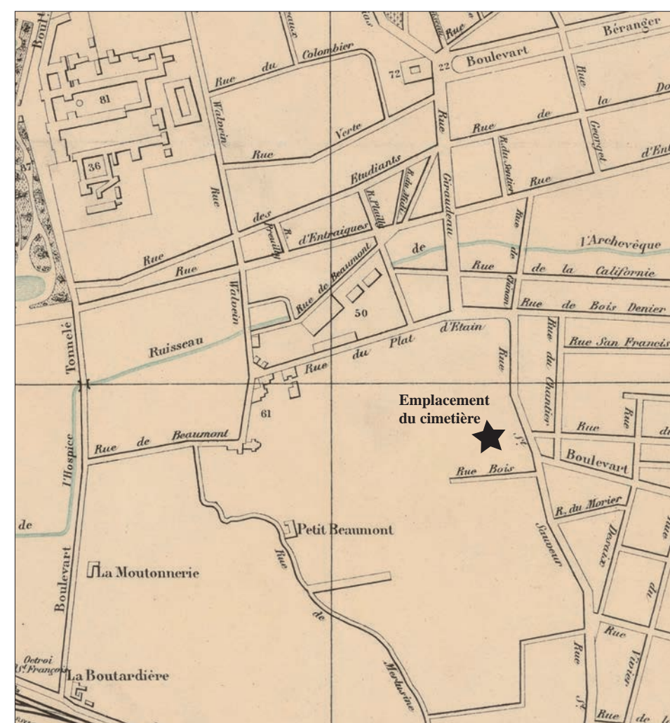
4. « Nouveau plan de Tours », 1893 BNF, Département des Cartes et Plans GE C-1740, Gallica Ce plan de 1893 représente un espace vide à l'emplacement du cimetière