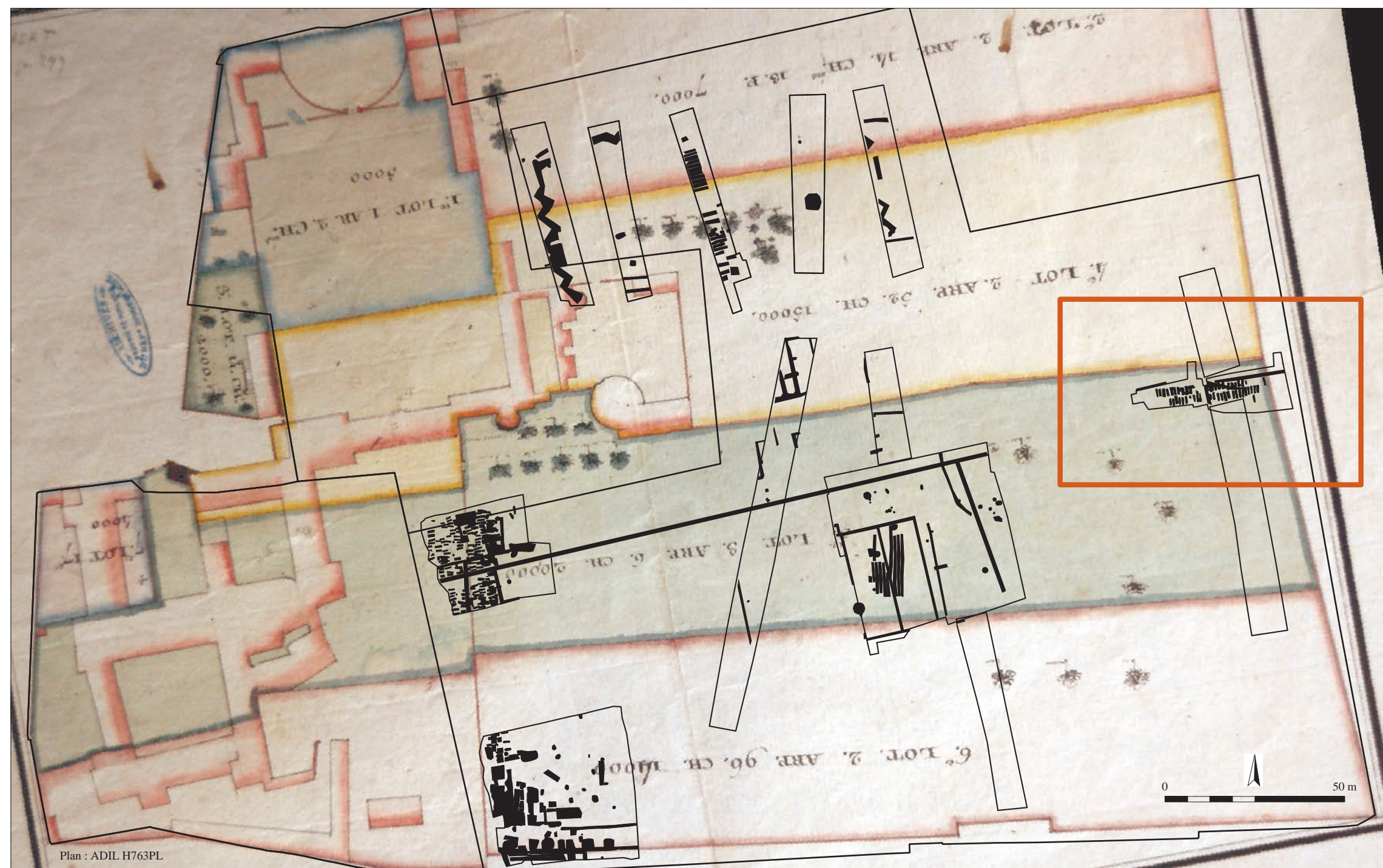
3. Plan de l'abbaye de Beaumont (ADIL H763PL) Le plan de l'abbaye de Beaumont à la Révolution indique une zone vide à l'emplacement du cimetière. Le mur de terrasse et le mur d'enclos formant une limite sont en élévation durant tout le XIX e s.