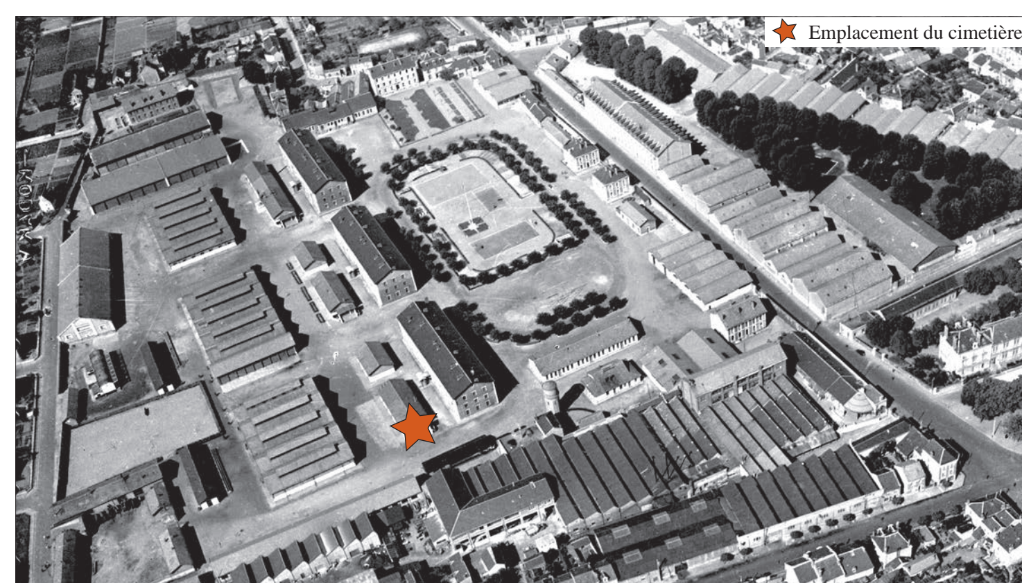
5. Vue des casernes Beaumont et Chauveau. Photographie Ariscaud, 1948 (ADIL 5F000698)