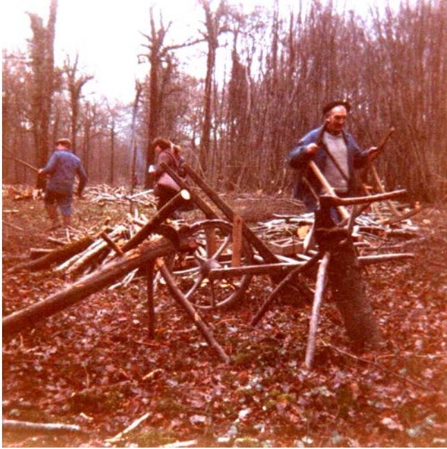
Figure 7 – Photographies prises pendant le tournage des Bochetons , Saint-Baudel, 1982