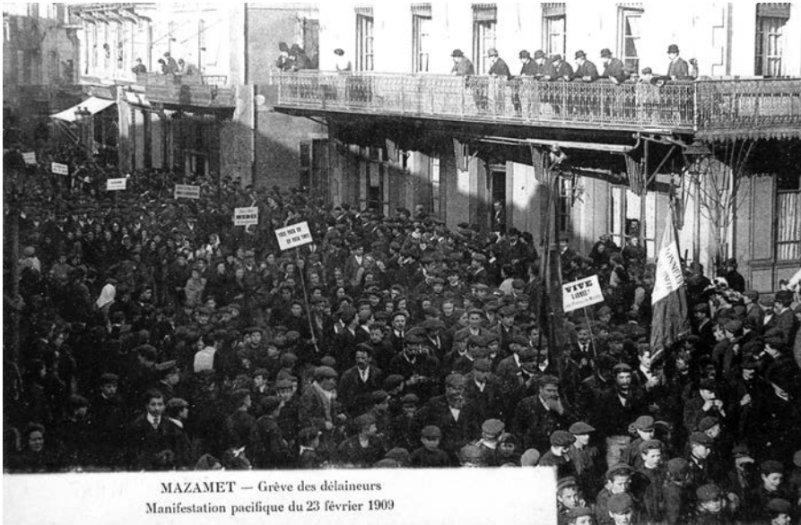
Figure 1 – Manifestation des grévistes dans la rue principale de Mazamet (23 février 1909)

Carte postale utilisée par Rémy Cazals pour susciter les souvenirs des témoins interviewés dans les années 1970.