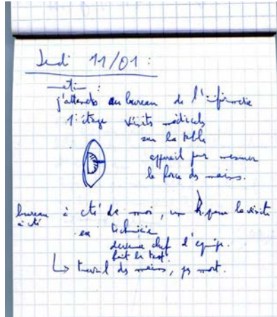
« Note de chaîne » prise par Nicolas Hatzfeld à Peugeot-Sochaux

D'un côté, une petite page de carnet, de l'autre, sa transcription à l'ordinateur un mois plus tard, puis la photo de l'objet reçu en cadeau que je garde depuis, et sa postérité immédiate et lointaine, en point de départ du mémoire d'HDR.