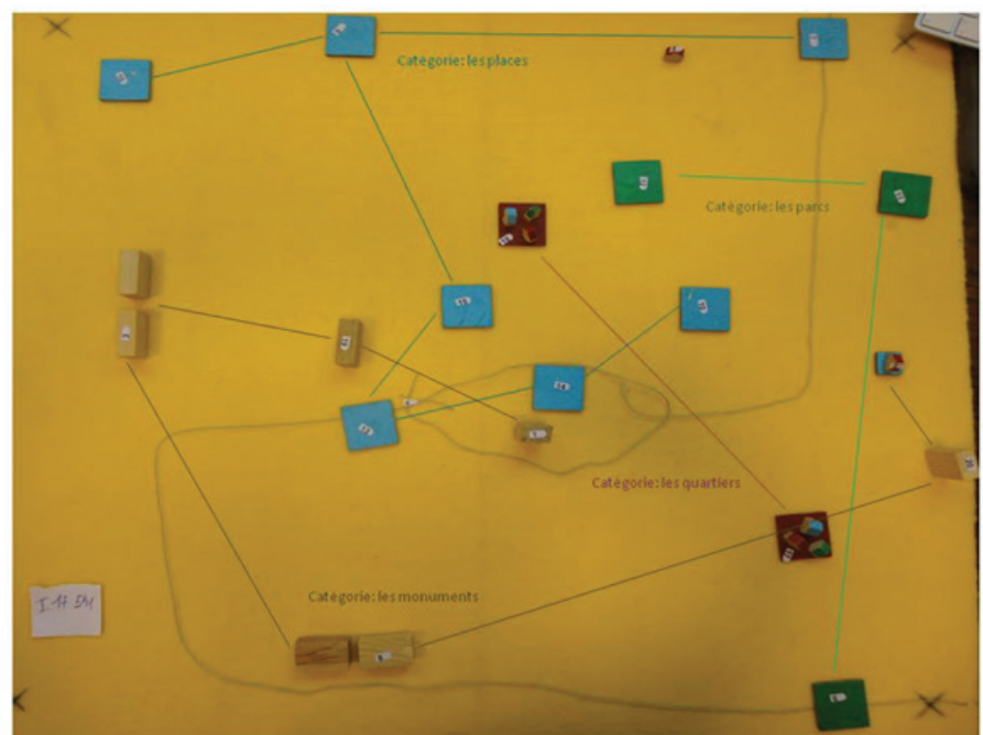
Image 3 : Photo d'une reconstruction spatiale de Strasbourg illustrative d'associations par analogie, c'est-à-dire des points de référence comme éléments des catégories spatiales entitatives

Photo d'une reconstruction spatiale de Strasbourg illustrative d'associations par extension, c'est-à-dire des points de référence comme éléments des catégories spatiales prototypiques