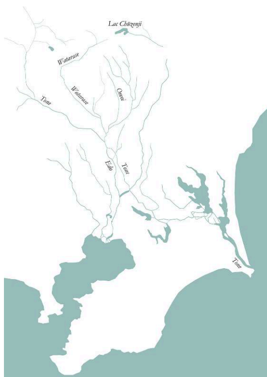
Figure 2 : Bassin versant du fleuve Tone.

Établi sur la base de « Kantō hasshū chū ichi fu go ken ni kakawaru kōdoku higaichi no zenryakuzu (Plan complet des terres contaminées par la pollution minière qui touche cinq départements et une préfecture parmi les huit provinces de la région du Kantō) », reproduit dans FUJIOKACHŌSHI HENSAN IIN-KAI (Comité d'édition de l'histoire de la ville de Fujioka), Fujioka chōshi. Shiryō hen. Yanaka mura (Histoire de la ville de Fujioka. Recueil de sources. Village de Yanaka), Fujioka (Tochigi), Fujiokashi, 2001.