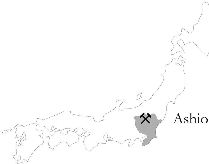
Figure 1 : Plan de situation de la mine d'Ashio et des régions concernées par l'affaire.

Réalisation, Cyrian Pitteloud et Marina Hokari, 2022, d'après des cartes d'époque.