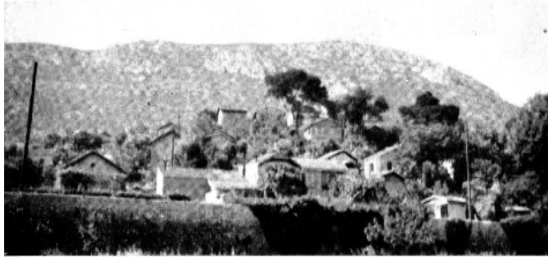
Villas et toits à pignon en rive gauche de l'Huveaune (quartier de La Valbarelle)

début des années 1950