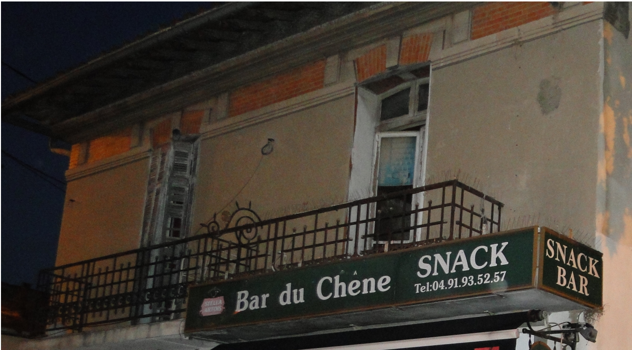
État actuel de l'immeuble Stripoli-Moccia à Beaumont (détail du premier étage). Entablement en briques et ciment réalisé en 1906. L'établissement du rez-de-chaussée a conservé le nom de « Bar du Chêne »