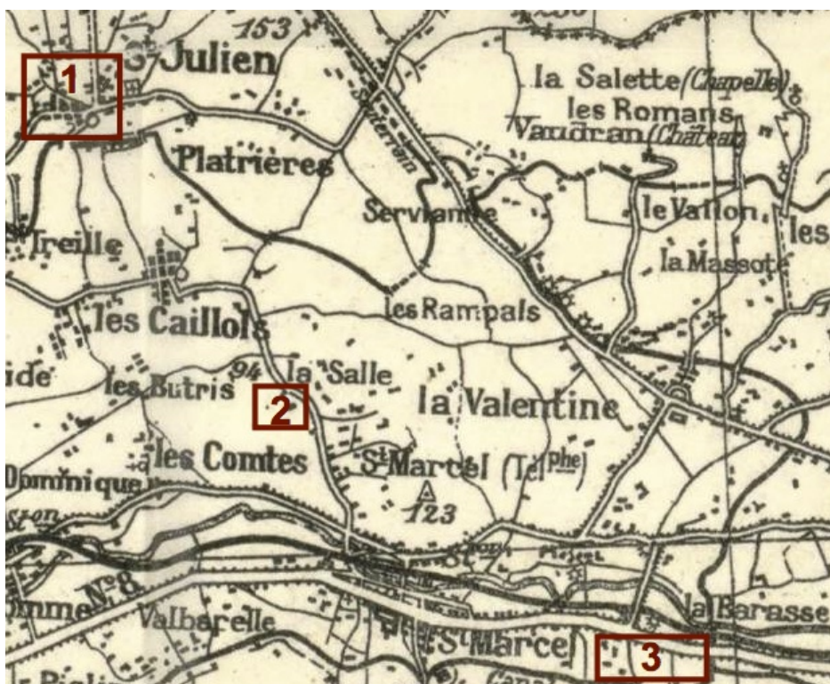
Localisation de quelques opérations de lotissement dans les quartiers Est au tournant des années 1890 et 1900

1 : Lotissement de Beaumont sur le plateau de Saint-Julien