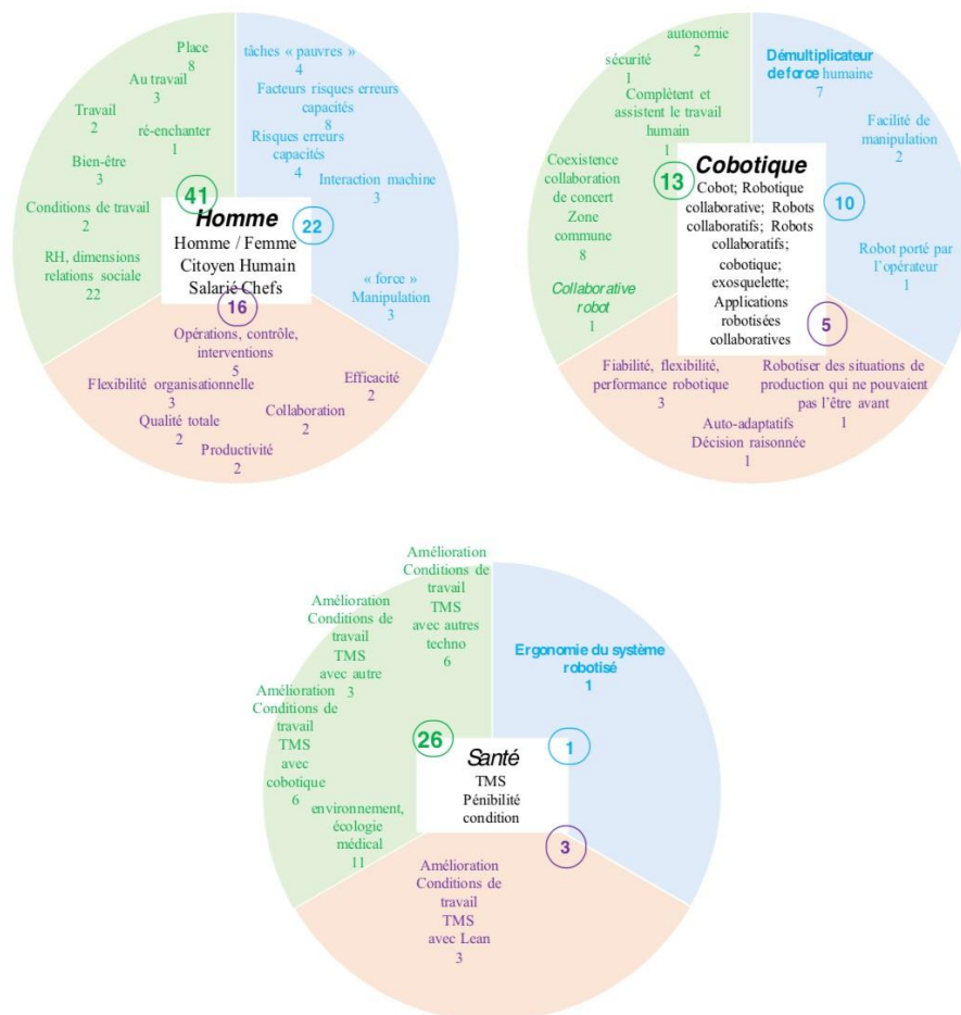
Figure 2. Résultats thèmes « Homme », « Cobotique », « Santé »

La figure 2 ci-dessus décrit les résultats dans les trois catégories inductives pour les thèmes « Homme », « Cobotique », « Santé ».