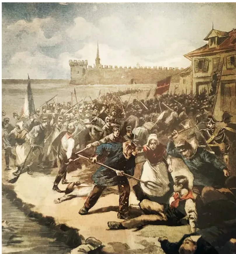
Massacre de paludiers italiens à Aigues-Mortes en 1893. La Tribuna, 1893

Des incidents similaires se produisent dans le reste du pays, des rixes éclatant à Paris, Vitry-sur-Seine, Choisy-le-Roi et Nancy. Et l'adhésion de l'Italie à la Triple Alliance avec l'Allemagne et l'Autriche-Hongrie l'année suivante n'arrange pas les choses et dessert l'image des Italiens, perçus comme menaçant.