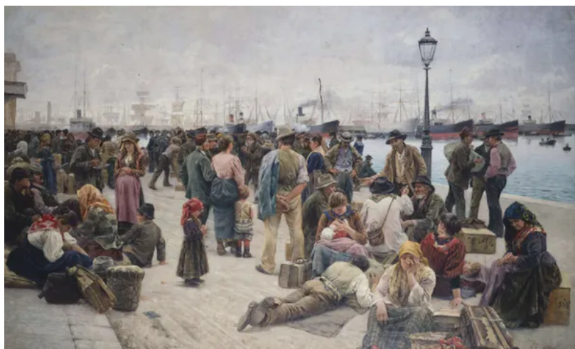
Gli Emigranti, Angelo Tommasi, 1896. Galleria nazionale d'arte moderna e contemporanea, Rome

En France, la communauté italienne représente la majeure partie des immigrants entre le début du XX e siècle et les années 1960. Environ 26 ou 27 millions d'Italiens ont quitté leur pays entre les années 1870 et 1970 pour se répartir sur tous les continents. Si la mémoire collective semble avoir occulté certaines choses à la suite de mouvements migratoires ultérieurs, extra-européens et post-coloniaux, dont l'altérité apparaît plus marquée et plus menaçante, l'histoire est là pour nous rappeler que la vie des Italiens en tant que migrants n'était pas plus facile, ils n'ont pas toujours été bien accueillis, quelle que soit leur destination.