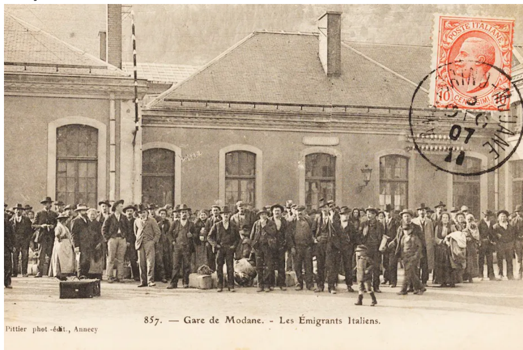
857. — Gare de Modane. - Les Émigrants Italiens.